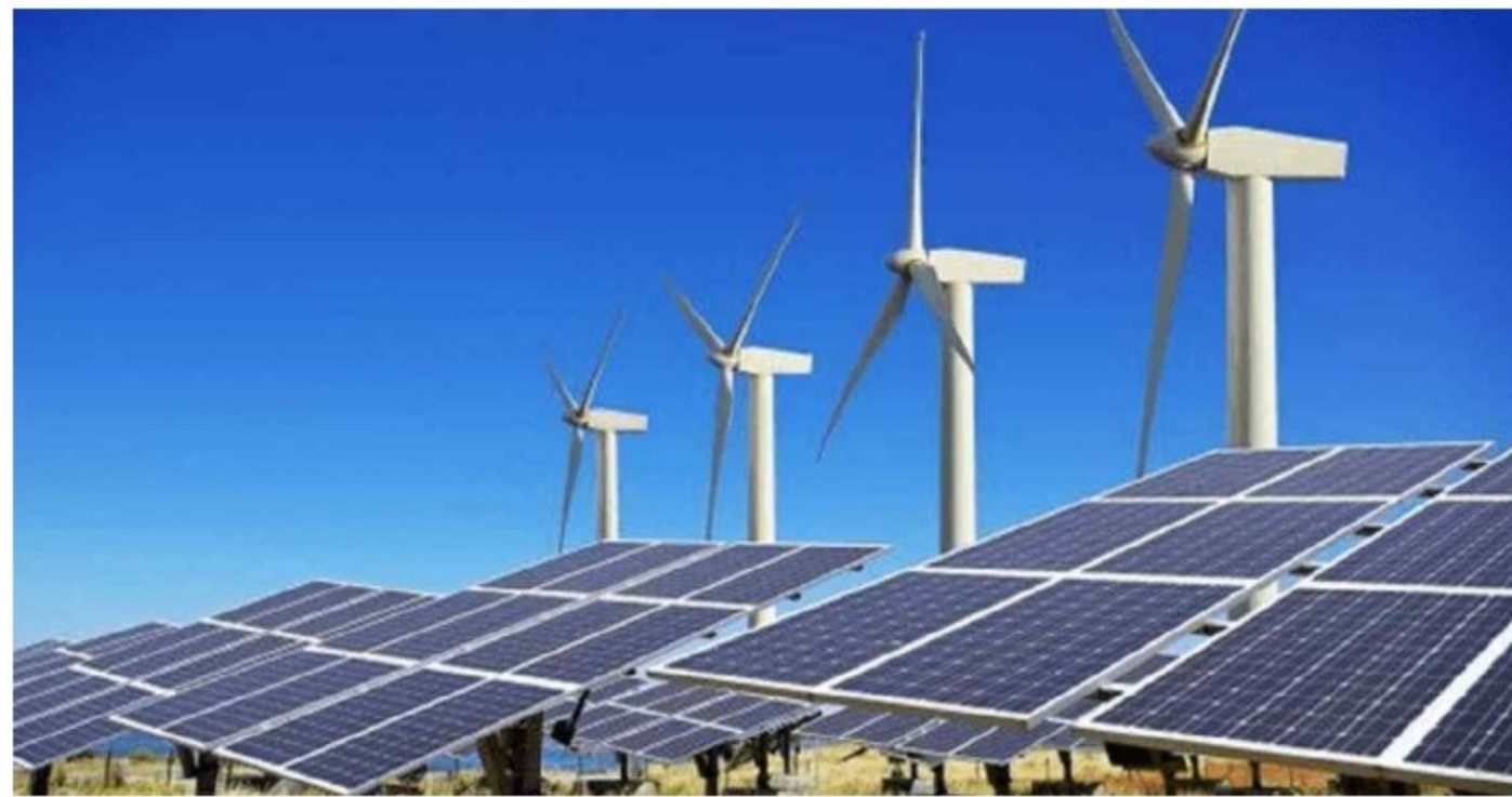
Paneles solares, energías limpias, energías renovables

Las últimas cifras de inversión extranjera, apoyadas por Procolombia, demuestran el creciente interés por parte de compañías internacionales en el mercado colombiano para invertir en proyectos de energías renovables.