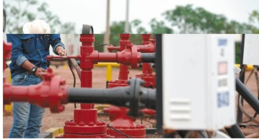
Gremio petrolero sostiene que el país tiene reservas de gas para elevar la autosuficiencia en este combustible.