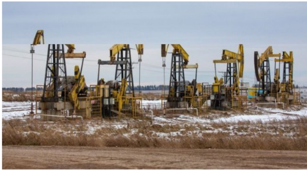
A la baja cierra el precio del crudo esperando reunión del cartel de la OPEP+.

La OPEP y sus aliados debatieron un posible aumento de la producción, retrasando un día las conversaciones preliminares entre ministros para permitir más tiempo para un compromiso antes de una reunión crítica el jueves.