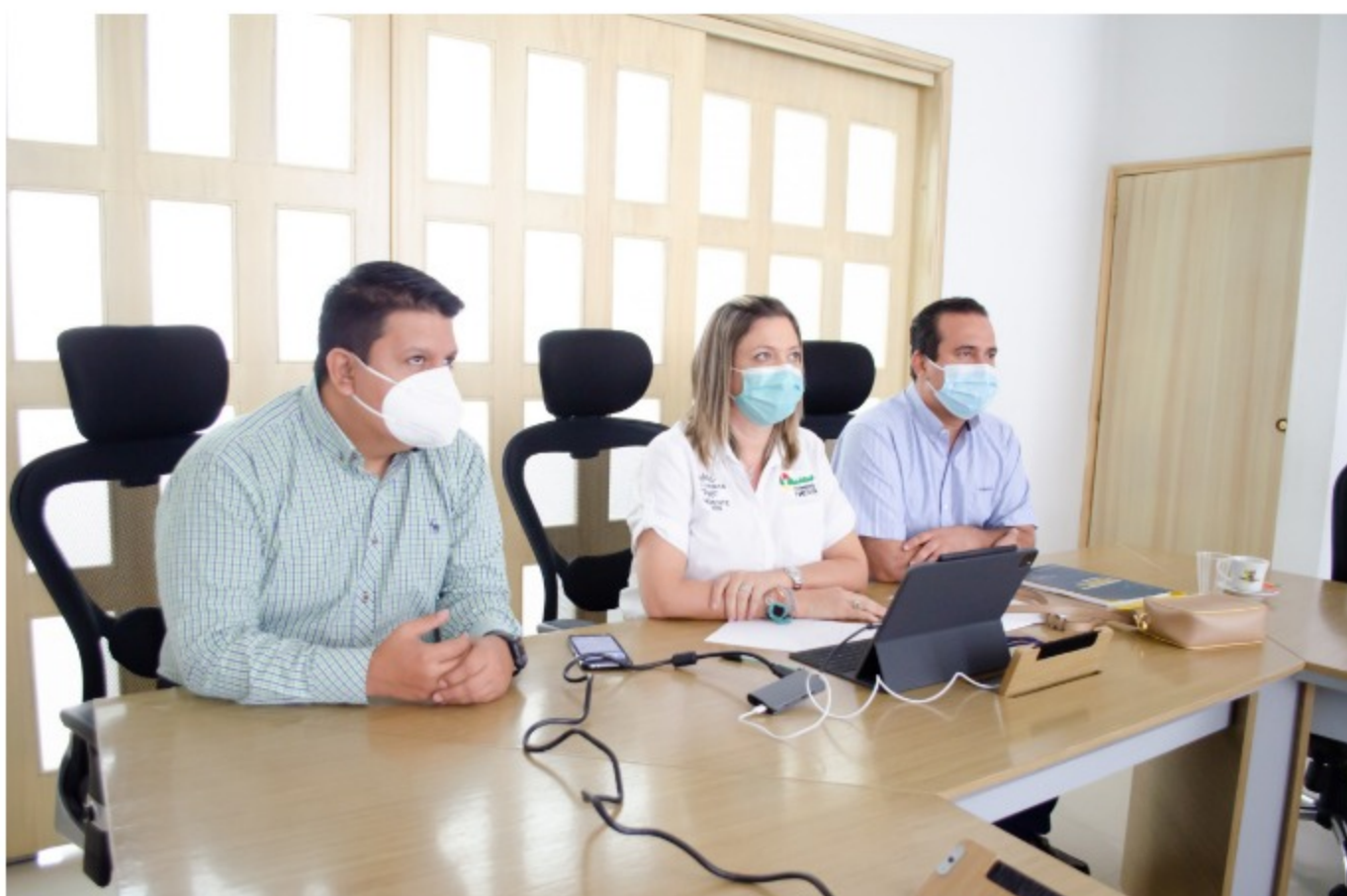
Actualmente, el proyecto avanza en la etapa de definición de los recursos que serán aportadas para garantizar su construcción.

Actualmente, el proyecto avanza en la etapa de definición de los recursos que serán aportadas para garantizar su construcción. Gracias a la gestión del alcalde de Neiva, Gorky Muñoz, el Ministerio de Vivienda, Ciudad y Territorio se ha comprometido a girar $124.780 millones de pesos, unos 6.000 millones de pesos anuales por 20 años, que serán fundamentales para la construcción.