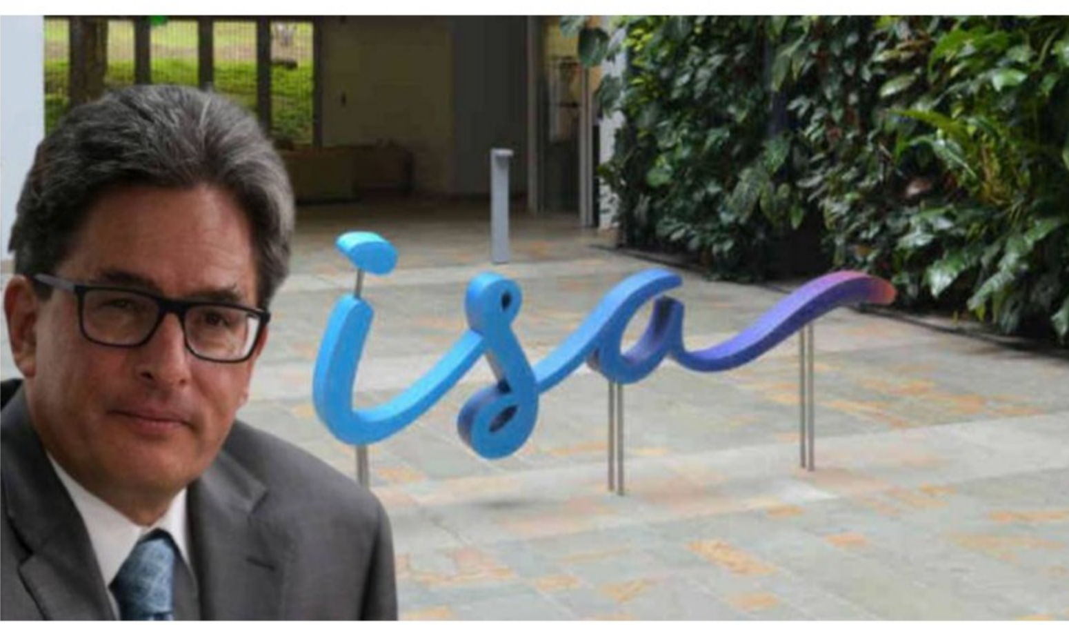
El ministro de Hacienda, Alberto Carrasquilla, reabrió el proceso para vender la participación de la Nación en Interconexión Eléctrica SA (ISA).

La lógica del negocio es sencilla: por un lado el Gobierno podría recibir cerca de 14 billones de pesos por esta venta. Recursos que le serán muy útiles para aclarar su panorama fiscal y atender algunas necesidades urgentes de la pandemia. Por otra parte, Ecopetrol diversificaría su negocio de cara a la transformación energética, teniendo en cuenta que el negocio del petróleo tarde o temprano dejará de ser rentable y sostenible.