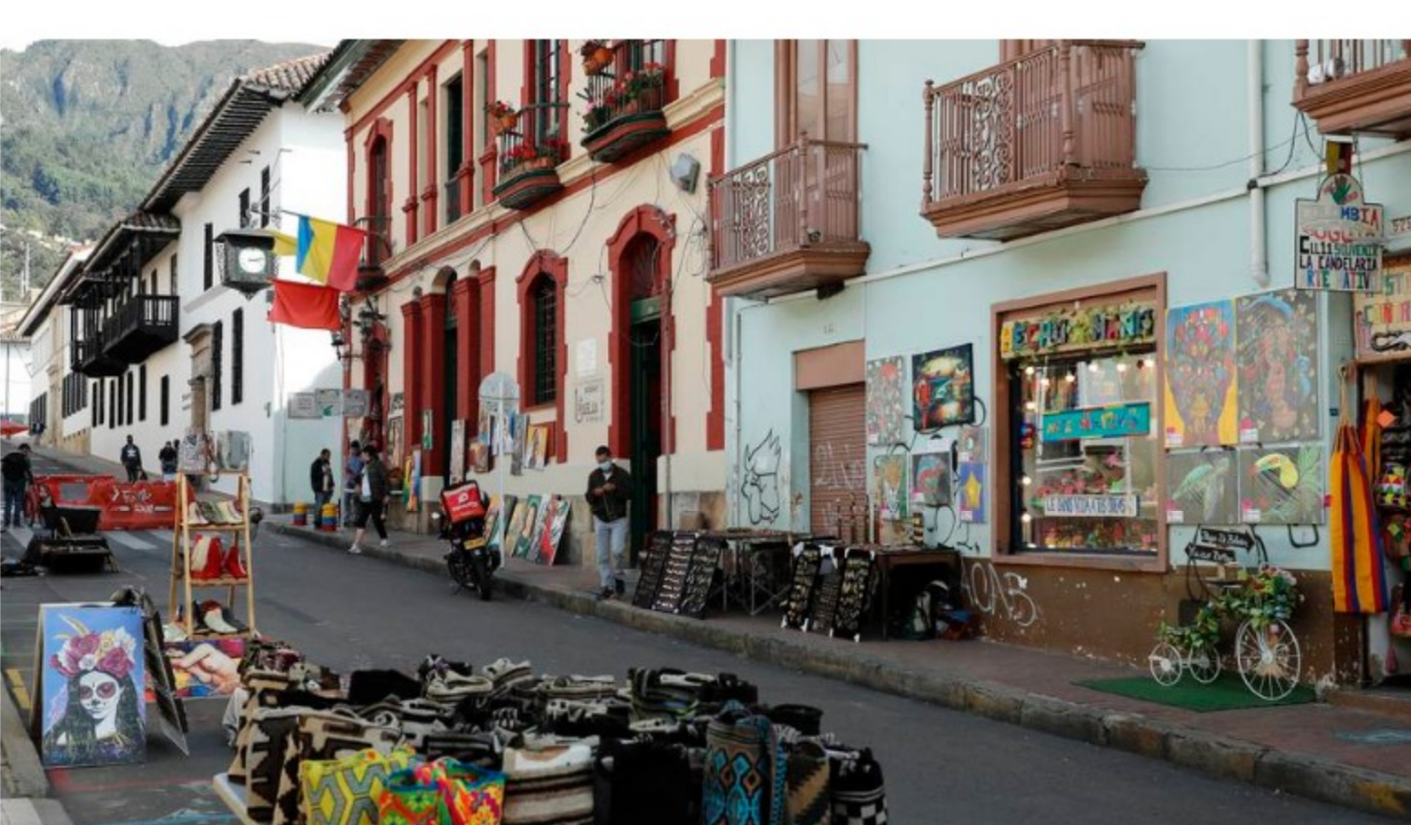
Centro de Bogotá, La Candelaria.

Por otro lado, también se refirió a la reforma tributaria que prepara el Gobierno y que será presentada el próximo 16 de marzo ante el congreso.