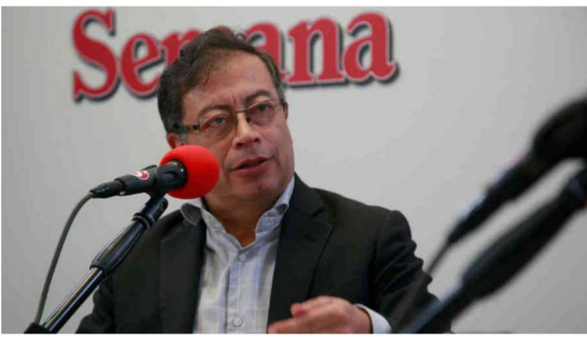
Gustavo Petro, senador, en las instalaciones de la revista Semana, en Bogotá

Desde hace varias semanas, se conoció el interés de Ecopetrol de adquirir el 51,4% de la participación del estado en ISA. El gobierno, dueño de ese porcentaje a través del ministerio de Hacienda, informó que aceptaría la oferta no vinculante de la petrolera y todo parece indicar que este negocio no tiene reversa.