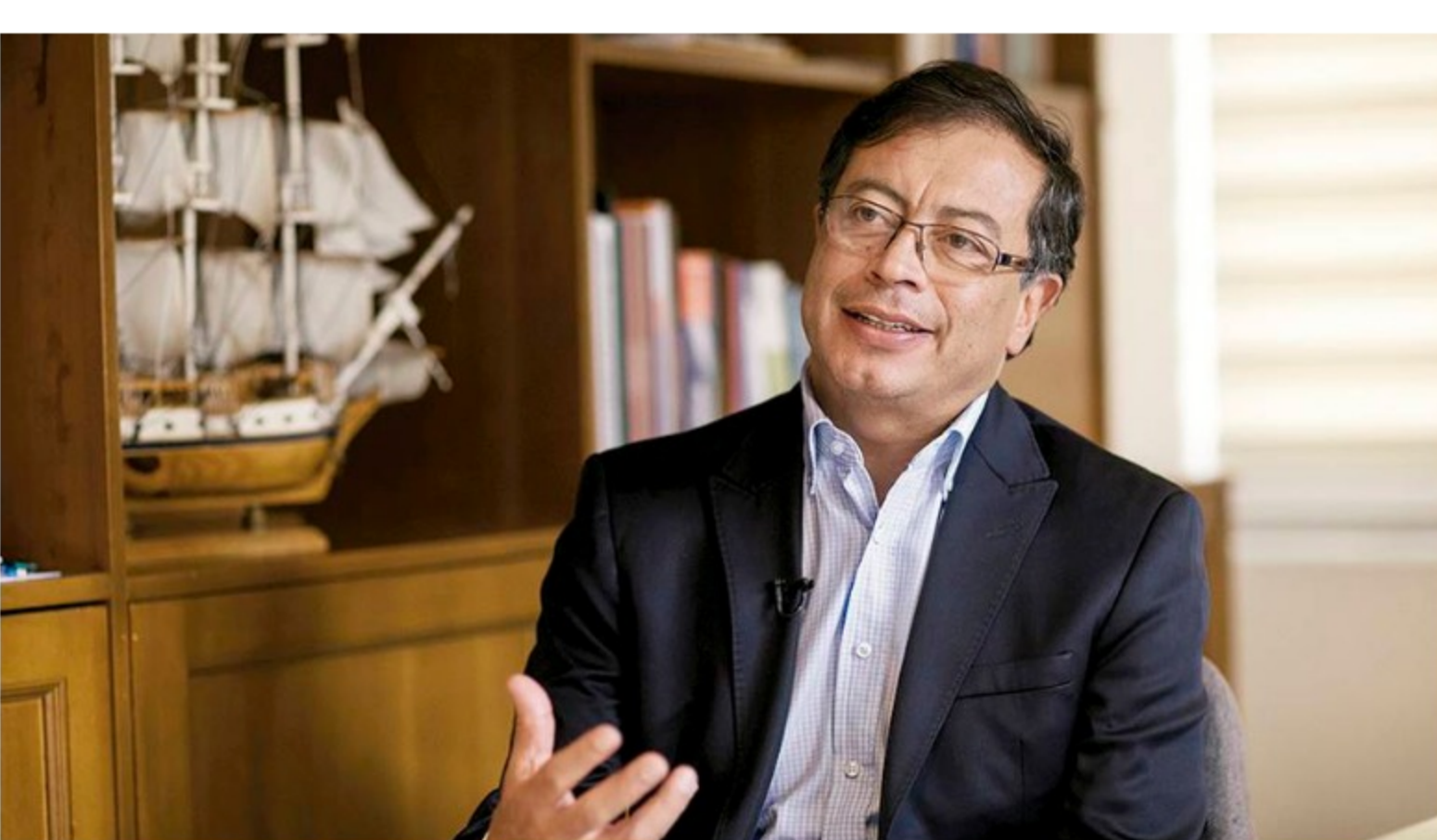
Gustavo Petro

Frente al fracking , Petro dijo que es irracional y que el Gobierno no debería perder el tiempo hablando de este tema, pues en su concepto, lo que el país necesita es avanzar en un nuevo modelo de desarrollo.