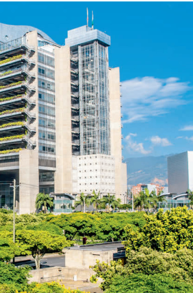
canzó 1,3 billones de pesos.

los planes en Afinia, por mencionar solo algunos de los proyectos estratégicos, exigen recursos de inversión muy cuantiosos”, recordó Vélez de Nicholls, quien agregó que una calificación inferior también po-