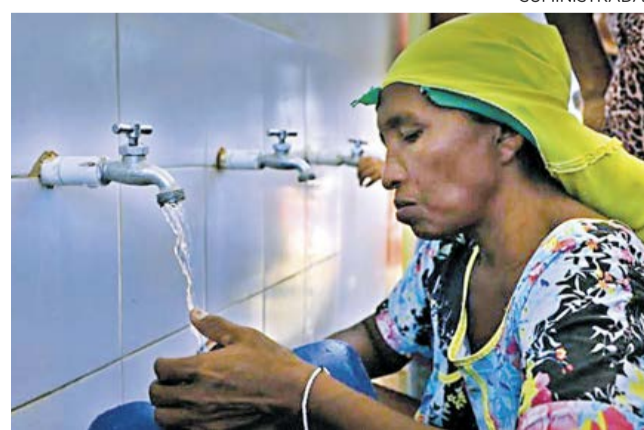
El proyecto de agua beneficiará a 55.154 personas.

El ministro de Vivienda, Jonathan Malagón, explicó que estos estarán ubicados en Flor de La Guajira, Punta Espada, Zona Industrial y Puerto Estrella, en Uribia; La Gloria y Sichichon, en Manaure;