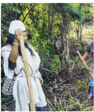
Índigena en los cultivos.

La estrategia busca fortalecer las vocaciones productivas de los grupos étnicos y las comunidades indígenas en las zonas de influencia de la actividad de hidrocarburos.