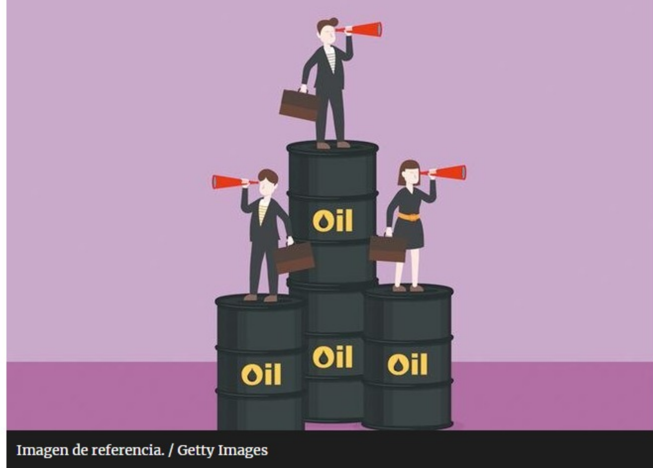
Imagen de referencia.

La distribución mundial de la vacuna para superar la crisis sanitaria del COVID-19 ha permitido debilitar la oferta en favor de la demanda de petróleo . Este escenario mejora la perspectiva de la industria petrolera en el mundo, algo que ha llevado la cotización del Brent al nivel más alto en el último año.