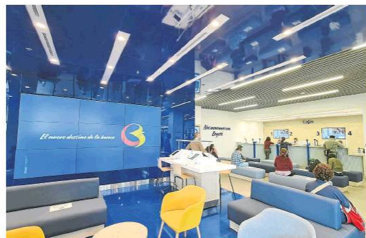
Banco de Bogotá

El Banco de Bogotá, a través del Programa Apoyo al Empleo Formal del Gobierno (Paef), destinó en 2020 casi $656.000 millones para que 14.000 empresas pudieran realizar el pago de la nómina, tras la crisis generada por la pandemia. Para acceder al subsidio se debe certificar una disminución de 20% en ingresos y contar con la inscripción en el registro mercantil entre varios otros requisitos. (EF)