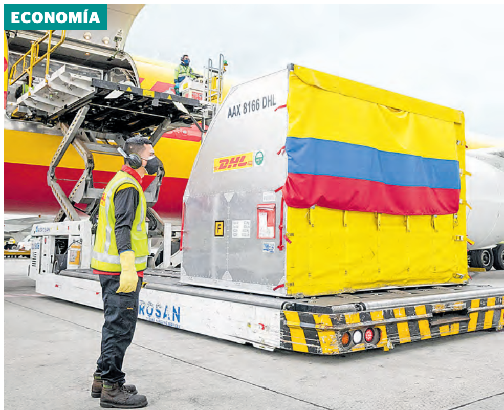
El país recibió ayer 50.000 dosis de Pfizer. Anticipará 3 días el comienzo de la inmunización.