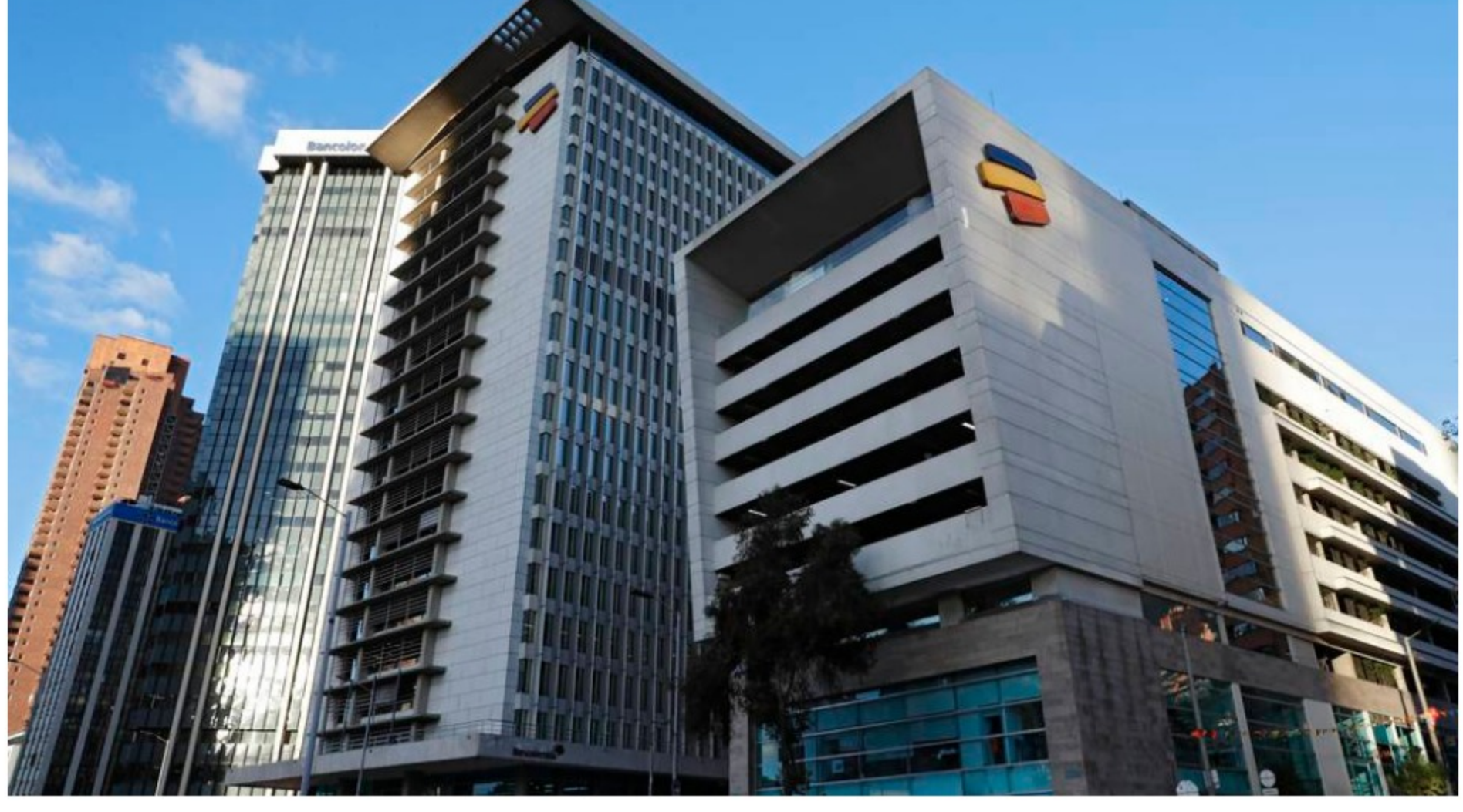
Bancolombia banco

La firma Standard & Poor's Global publicó su índice de sostenibilidad de 2021 en el que incluyó a 631 empresas de todo el mundo, entre las que se encuentran 14 colombianas destacadas por su compromiso en esta materia.