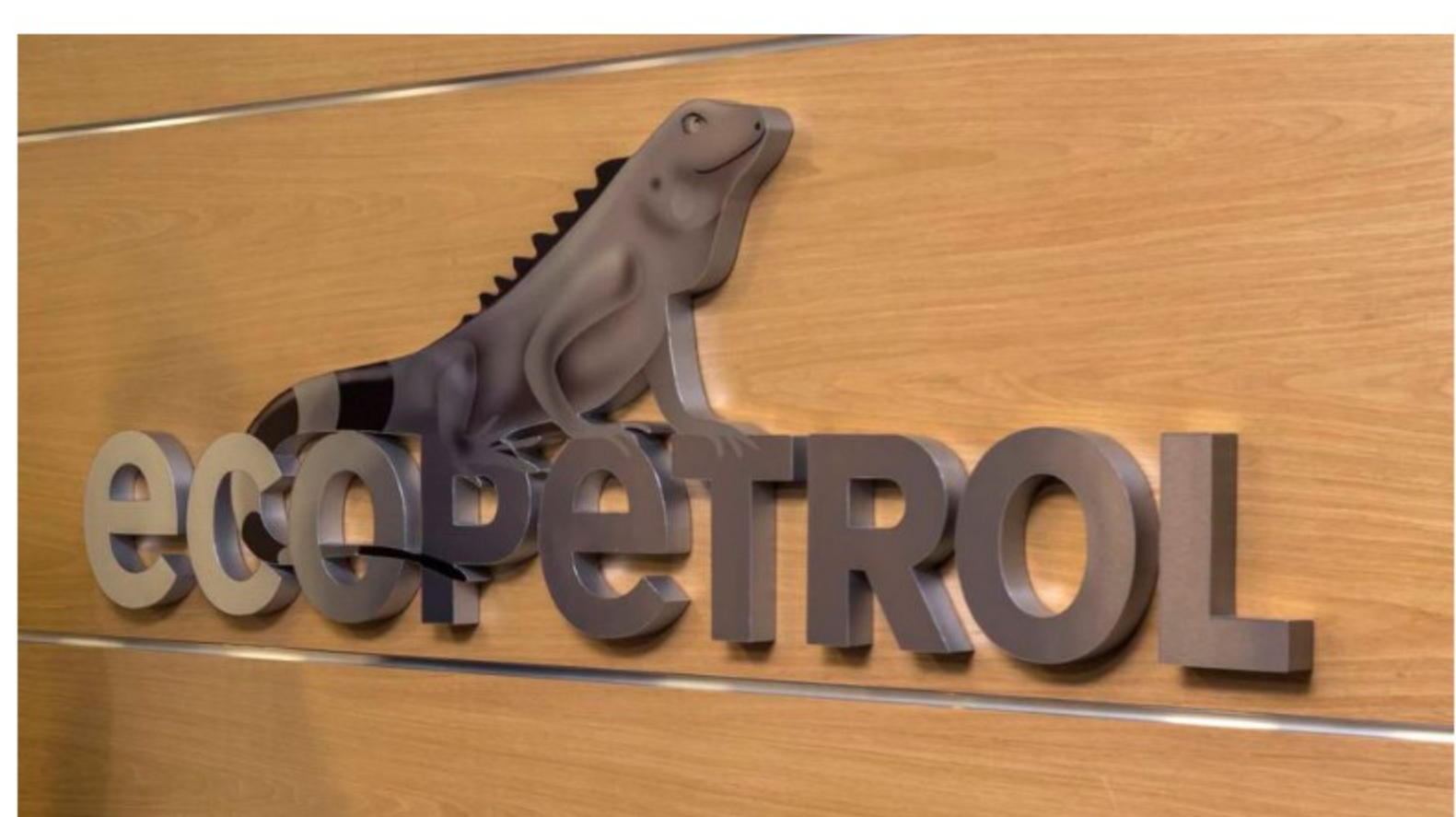
Multa a Ecopetrol por daño ambiental en Lisama 158 será ahora de $3.800 millones

Las empresas cuyo puntaje sea al menos 54 y se encuentre dentro de un rango del 5% al 10% del puntaje de la empresa con mejor desempeño de la industria reciben la distinción "SAM Bronze Class"; mientras que todas las empresas que se han incluido en el anuario, pero que no han recibido una distinción de medalla, se enumeran como miembros del Anuario de sostenibilidad .