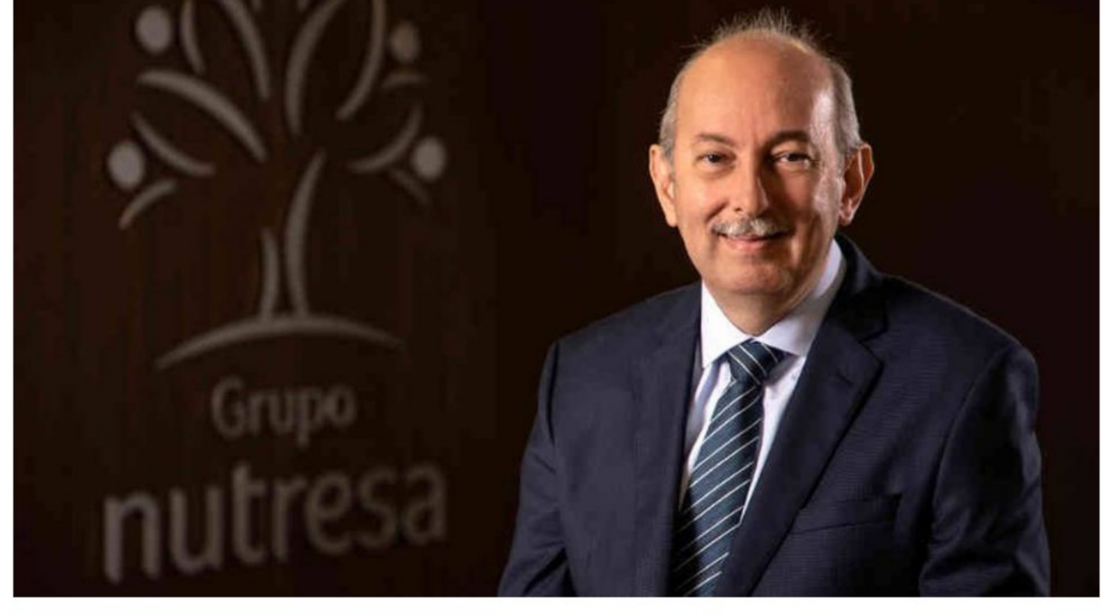
Grupo Nutresa creó una empresa en Sudáfrica

Dentro de cada industria, las empresas con una puntuación total mínima de 60 y cuya puntuación esté dentro del 1% de la puntuación de las empresas con mejor desempeño en su industria reciben el premio "SAM Gold Class ", explica S&P.