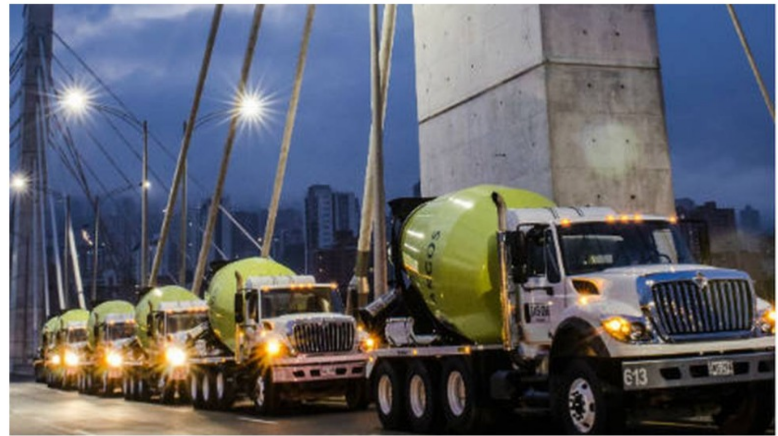
La inversión en programas de impacto ambiental y social corresponde al 32 por ciento de las utilidades de 2013.