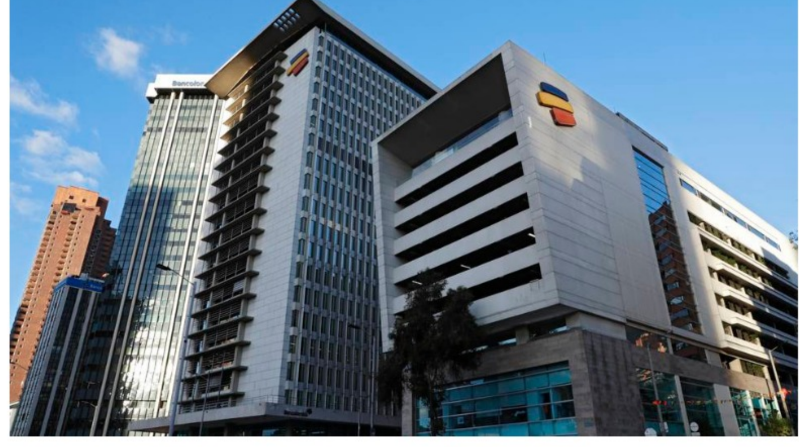
Bancolombia banco

Las que mejores resultados obtuvieron fueron Grupo Bancolombia y Grupo Nutresa , a las que se les entregó una calificación de "Gold Class" ; luego aparecen otras empresas que obtuvieron "Silver Class", entre las que se encuentran Cementos Argos , Grupo Argos y Grupo de Inversiones Suramericana .