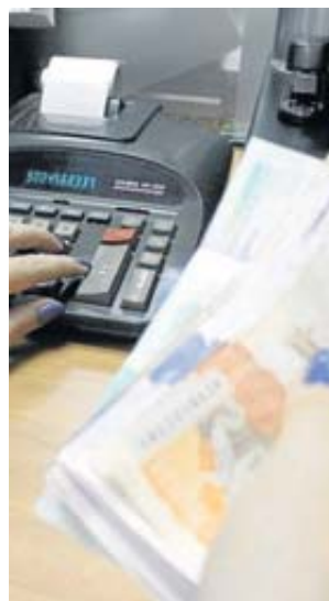
Marco Valencia / VANGUARDIA

Los empleadores que no hagan esta consignación podrían ser sancionados. Las multas para quien incumpla, de acuerdo con el Código Sustantivo del Trabajo, obligan al pago del equivalente a un día de salario del