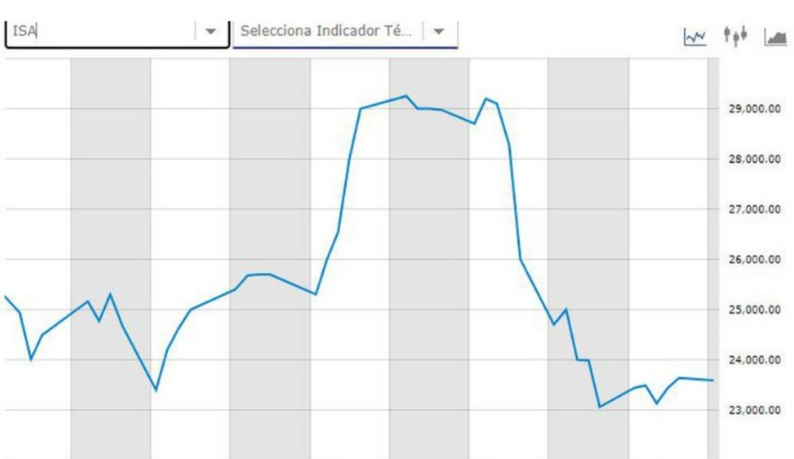
Acciones de ISA

“A comienzos del mes de enero observamos un desempeño sobresaliente en la acción de ISA, producto del comunicado proveniente del Gobierno Nacional donde manifestaba su interés en vender la compañía a una empresa pública ( Ecopetrol , GEB y EPM). Sin embargo, luego de conocerse que no habría OPA para la enajenación, ISA perdió su impulso, desvalorizándose cerca del 10,3%. Actualmente, observamos en el plano técnico una fuerte zona de congestión de corto plazo entre los $23.000 y $24.000”, dijo Casa de Bolsa.