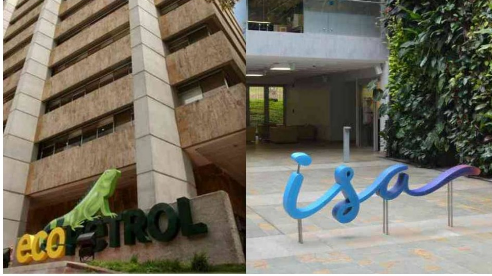
Venta de ISA: Así se han comportado las acciones de la empresa y Ecopetrol tras sus anuncios - Foto:

Para muchos, si se llega a materializar, la compra de ISA por parte de Ecopetrol sería el “negocio del año” pues se estaría conformado uno de los conglomerados energéticos más grandes de la región.