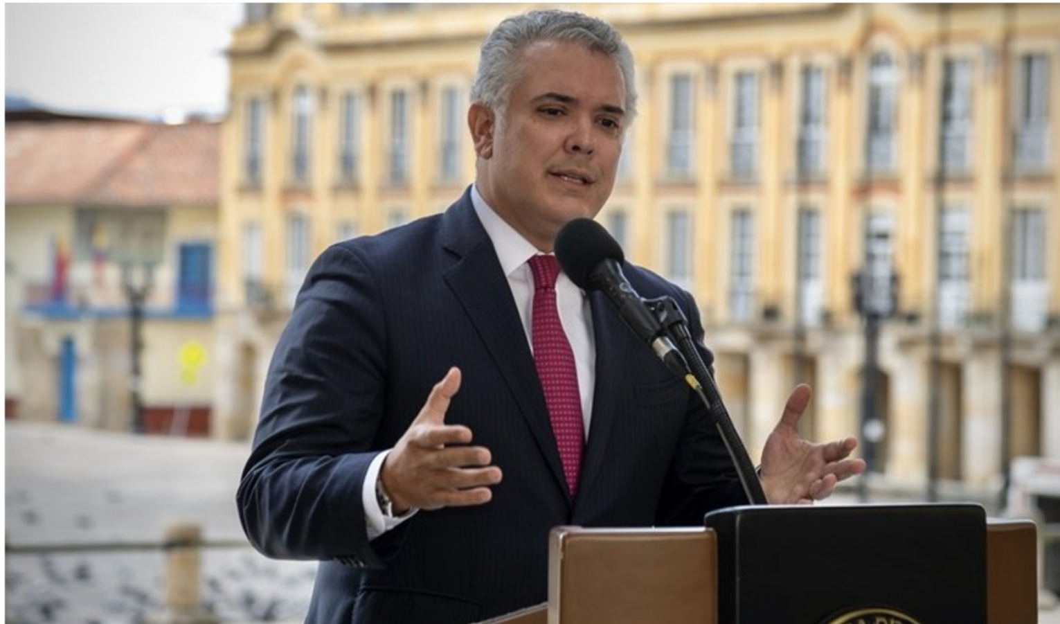
Venta de ISA a Ecopetrol .

El mandatario dijo que será la decisión más importante de emprendimiento y conglomerado energético de Colombia.