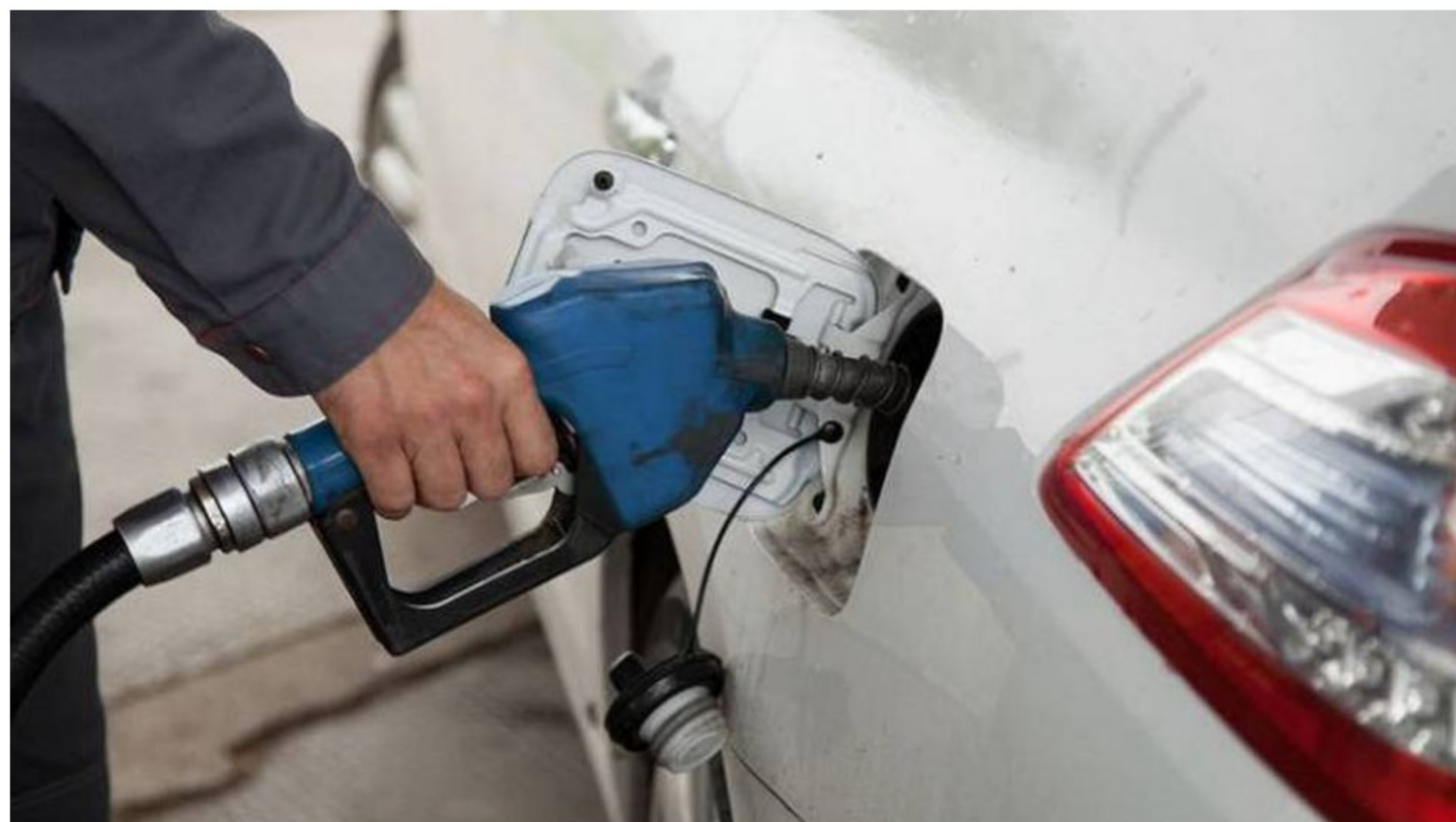
Según Ecopetrol , se pasó de un consumo de 3.600 barriles por día promedio/año en 2019 a 4.300 barriles por día.

Según Ecopetrol , durante noviembre y diciembre del año pasado, en Colombia se registró un aumento importante en la demanda de gasolina extra. Datos de la petrolera señalan que se pasó de 3.600 barriles por día (promedio/año) en 2019 a 4.300 barriles por día.