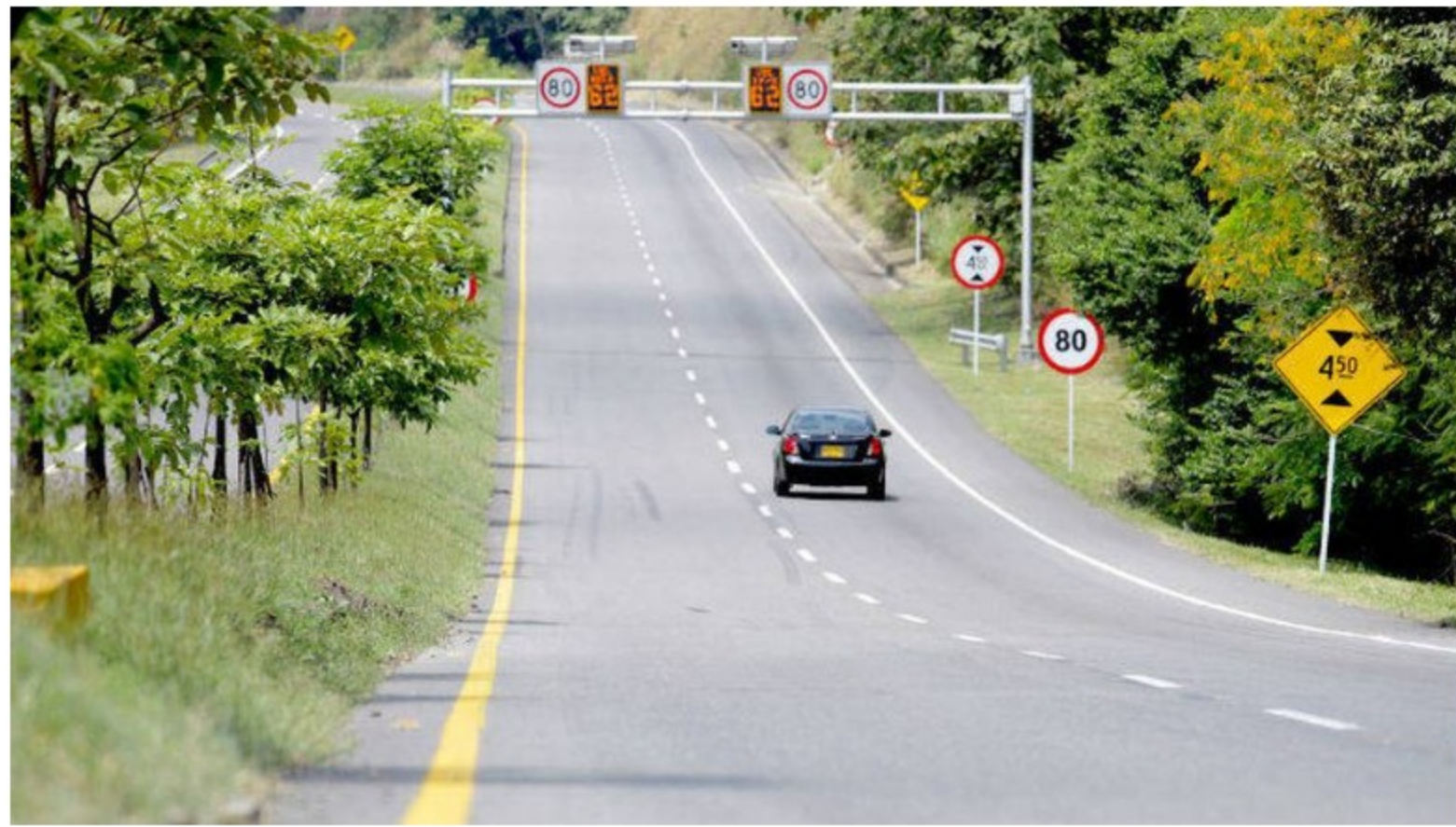
Las restricciones de viajes aéreos generaron un mayor uso de vehículos durante la pandemia. Esto disparó el uso de la gasolina extra, según Ecopetrol . - Foto:

“La reducción del contenido de azufre en los combustibles viene efectuándose desde hace tres décadas y se ha intensificado desde 2018 gracias a actualizaciones tecnológicas en la Refinería de Barrancabermeja para reducir el contenido de azufre en los combustibles que se producen y a ajustes en los sistemas de transporte por poliductos”, indicó Ecopetrol .