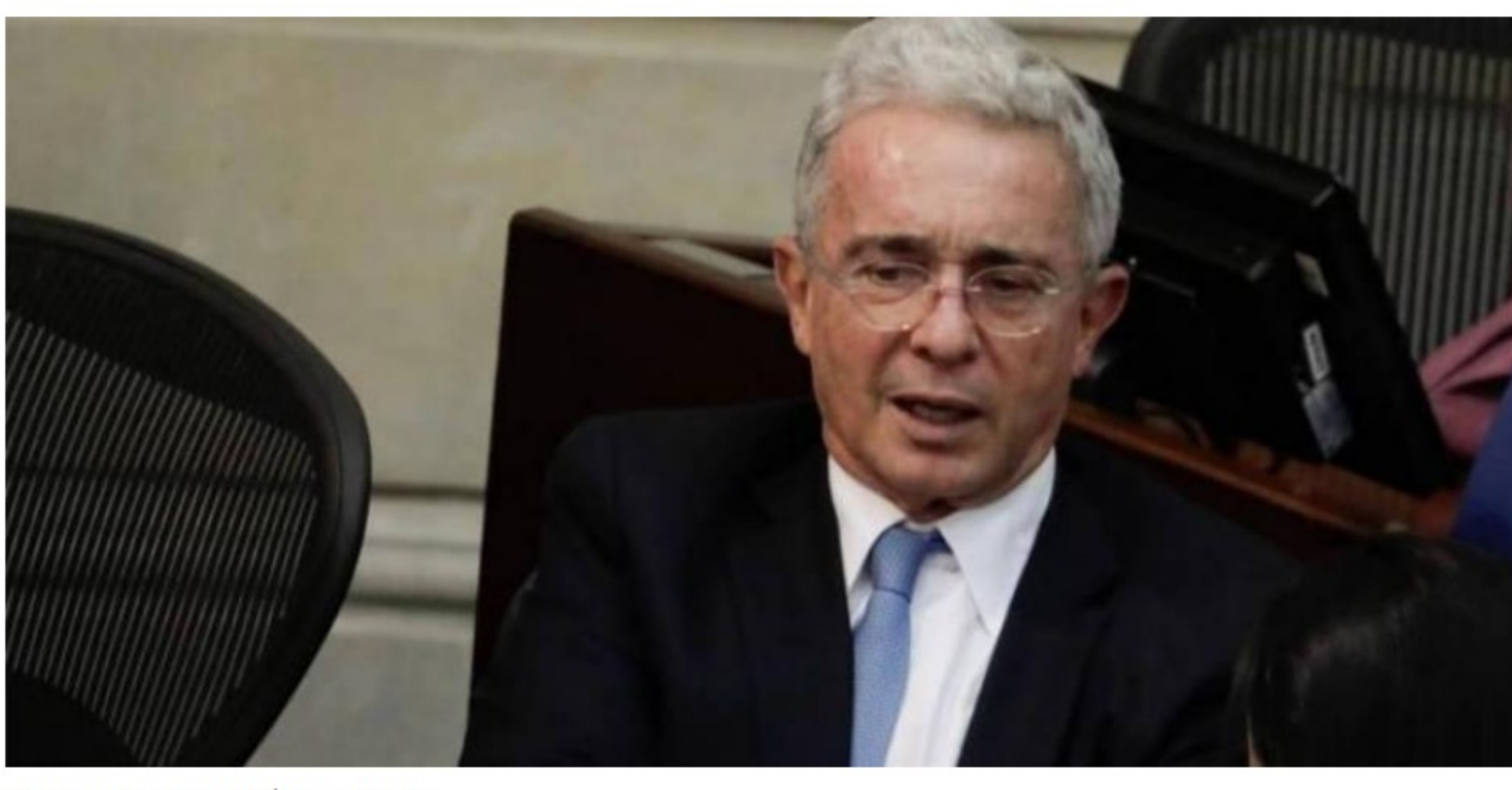
El expresidente y exsenador Álvaro Uribe Vélez.

RELACIONADOS: FARC | URIBE CENTRO DEMOCRÁTICO | PARAMILITARISMO