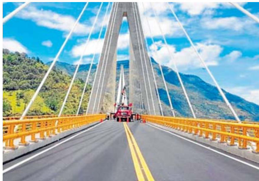
El primer laudo arbitral entre el Fondo Adaptación y Sacyr buscaba la construcción de puentes en La Judía y Pangote, de la vía Curos - Málaga.

Al parecer, el Fondo tendría que pagar una indemnización a la compañía española. Aún no se conoce el monto exacto, pero este laudo tribunal estaba por $40.000 millones.