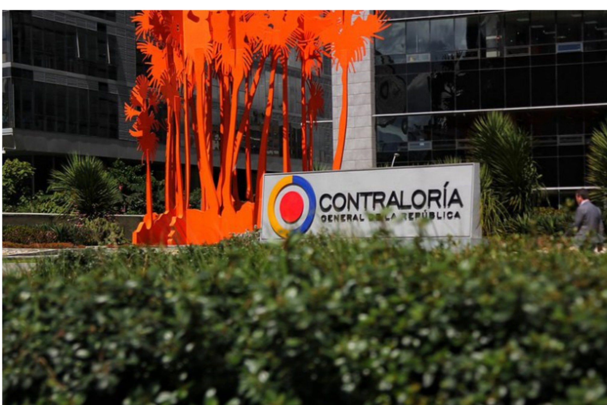
Fachada Edificio Contraloría.

La Contraloría General de la República emitió un comunicado señalando que, "la Unidad de Investigaciones Especiales contra la Corrupción imputó responsabilidad fiscal, a título de culpa grave, en cuantía de $31.261 millones de pesos contra ocho directivos en su momento de BIOENERGY ZONA FRANCA S.A.S., firma filial de Ecopetrol actualmente en trámite de liquidación, por la pérdida de recursos de BIOENERGY S.A", se lee en el documento.