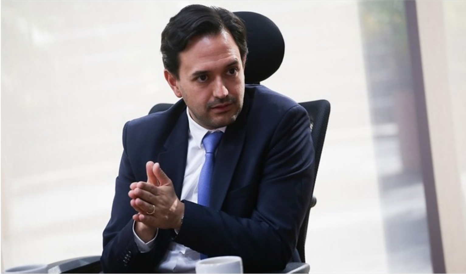
Ministro de Minas y Energía, Diego Mesa.

Para el Ministerio de Minas y Energía, en distintos puntos, de ser aceptada la propuesta, daría soluciones y brindaría seguridad minero energética al país.