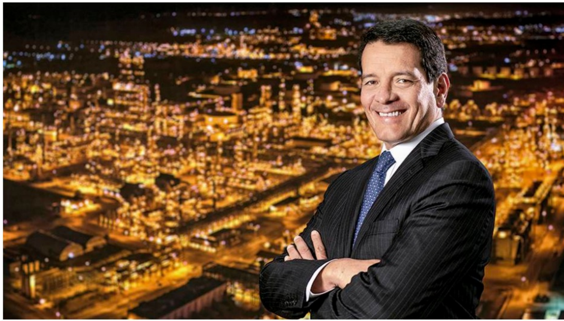
Felipe Bayón, presidente de Ecopetrol

Ecopetrol presentó este martes una oferta no vinculante para adquirir la participación que posee la nación en Interconexión Eléctrica SA. (ISA), equivalente al 51,4 % de las acciones en circulación.