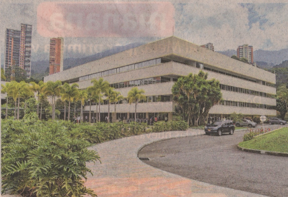
El 51,4% de la Nación en ISA, según analistas, equivale a cerca de unos $14,2 billones. ISA

de sus cerca de 4.000 empleados en 43 filiales y subsidiarias (58 en total sumando empresas con control compartido y otras inversiones).