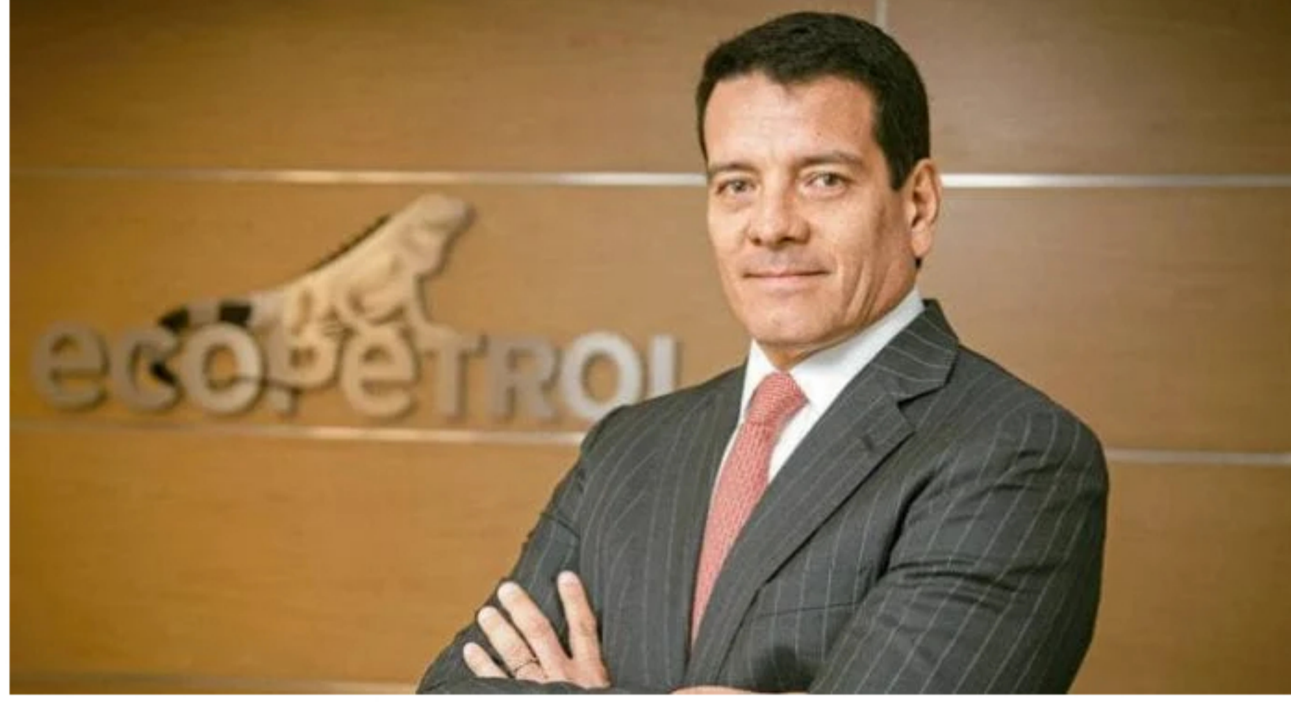
Felipe Bayón, presidente de Ecopetrol

El presidente de Ecopetrol, Felipe Bayón, amplió hoy en conferencia de prensa la propuesta bajo la cual la empresa hará una oferta no vinculante para adquirir la participación que posee la Nación y el Ministerio de Hacienda en ISA, equivalente al 51,4% de las acciones en circulación.