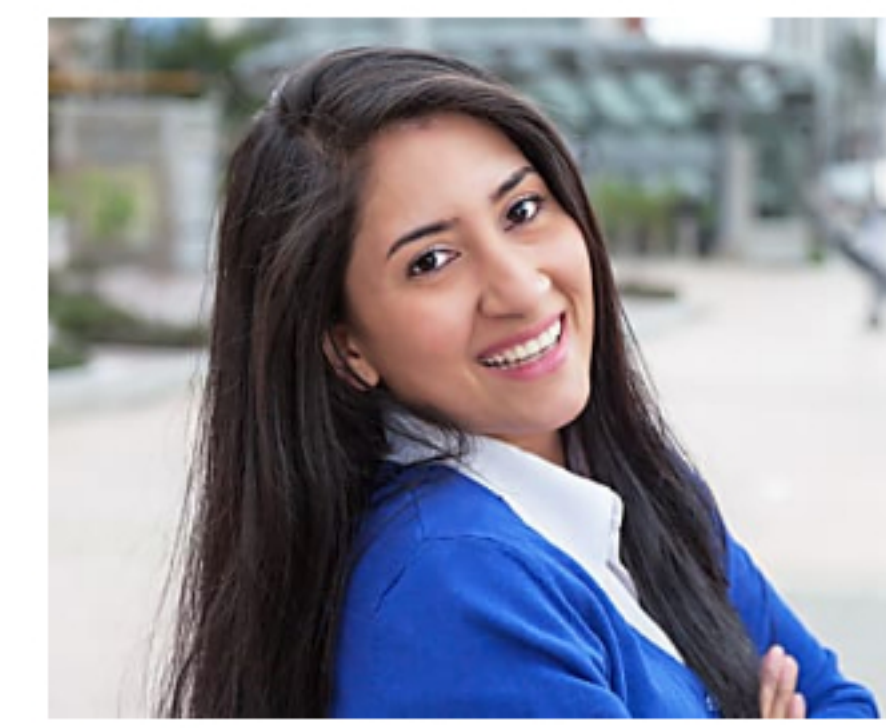
Lotería de EE.UU. ahora disponible en Colombia theLotter | Patrocinado