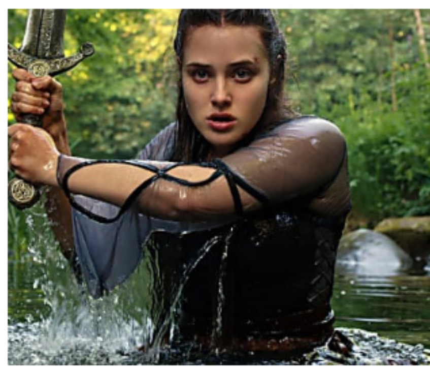
NETFLIX sin restricciones en Bogotá. Esto es lo que haces TheTopFiveVPN | Patrocinado