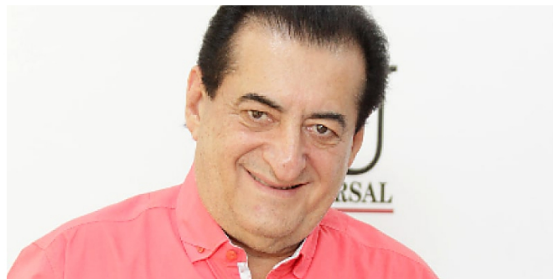
Se complica salud de Jorge Oñate, trasladado a sala COVID El 'Jilguero de América' sigue recibiendo el tratamiento médico en la clínica cardiovascular de Valledupar, donde está internado.