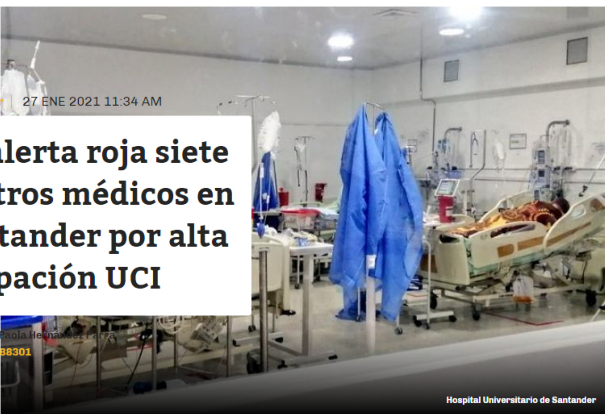
Hospital Universitario de Santander