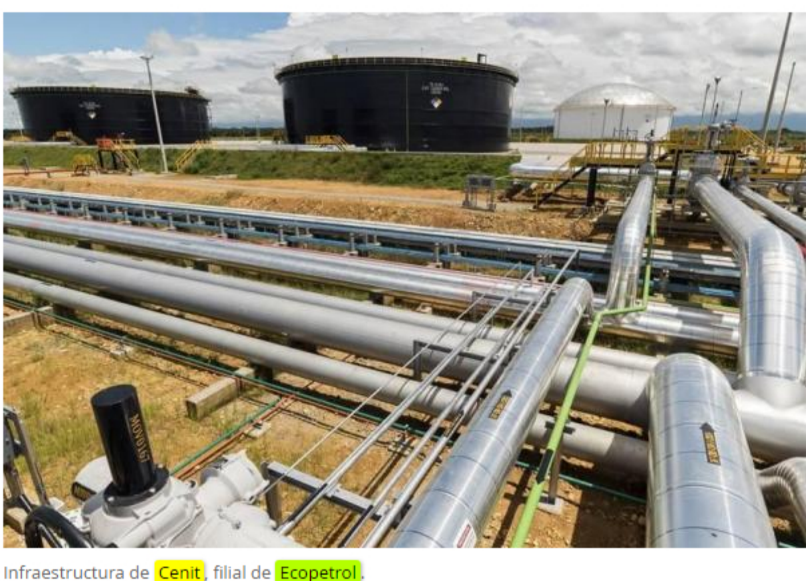
Infraestructura de Cenit, filial de Ecopetrol.

El CIO tiene cuatro salas. La primera es el centro de operación remota, al que llega la información de los casi 9.000 kilómetros de oleoductos y poliductos y las 54 estaciones, más los tres puertos que operamos. Desde Bogotá podemos operar las estaciones, abrir válvulas, prender y apagar bombas. Tenemos un levantamiento virtual de la infraestructura, para hacer mantenimiento, análisis de riesgo, autorizar contratistas y generar permisos de trabajo digital.