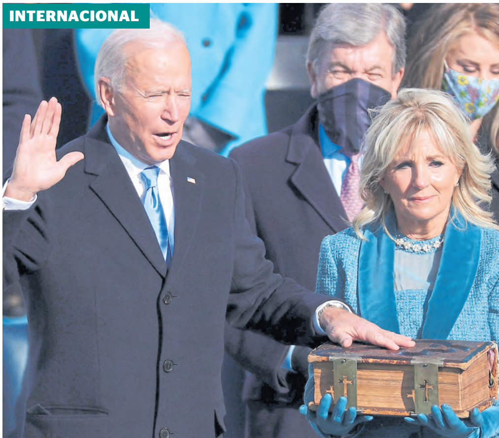
Con la mano en la Biblia, el mandatario juró cumplir con la Constitución.