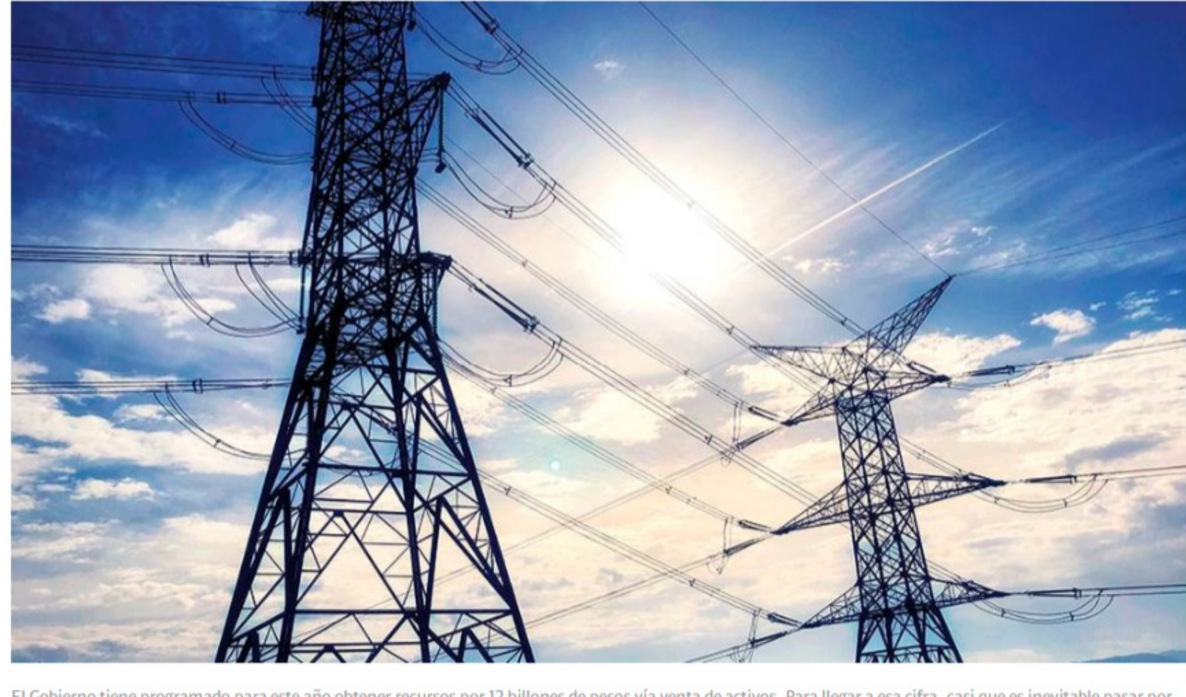
El Gobierno tiene programado para este año obtener recursos por 12 billones de pesos vía venta de activos. Para llegar a esa cifra, casi que es inevitable pasar por Ecopetrol o por ISA. - Foto:

La situación es tan compleja que el miércoles pasado la administración de ISA le pidió al Ministerio de Hacienda información sobre la operación porque no ha sido notificada. Ya el jueves, el ministerio confirmó que estaba analizando la posibilidad de enajenar su participación, pero no ha definido el mecanismo.