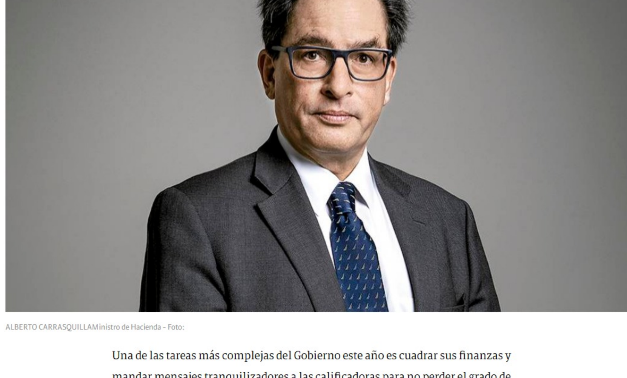
ALBERTO CARRASQUILLA Ministro de Hacienda

Una de las tareas más complejas del Gobierno este año es cuadrar sus finanzas y mandar mensajes tranquilizadores a las calificadoras para no perder el grado de inversión. El endeudamiento se acerca a 65 por ciento del PIB y la caída del recaudo en 2020 superó 20 billones de pesos.