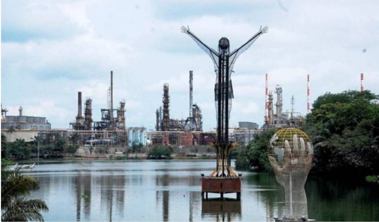
Las dosis serían distribuidas entre los trabajadores de la petrolera y la comunidad vulnerable.

Las dosis serían distribuidas entre los trabajadores de la petrolera y la comunidad vulnerable.