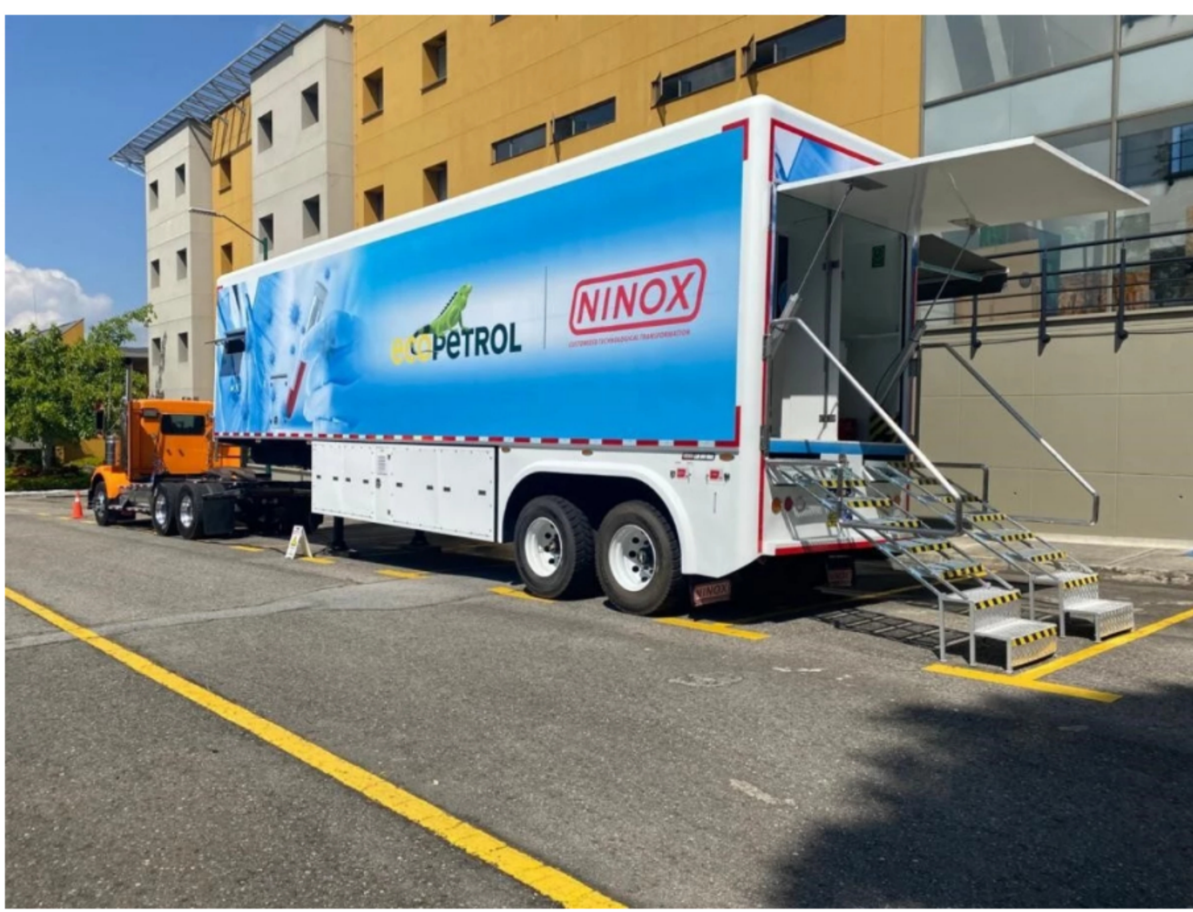
Tractomula Ecopetrol

El laboratorio móvil es el primero en su tipo en América Latina y tiene la capacidad de procesar pruebas PCR en cualquier lugar.