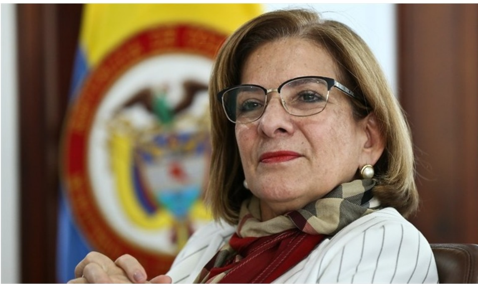
Es la primera mujer en toda la historia del Ministerio Público en sus más de 190 años.

La nueva procuradora deberá tomar decisiones disciplinarias que quedaron pendientes de la administración de Fernando Carrillo.