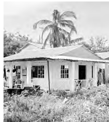
Inician intervención de 127 viviendas con daños en las cubiertas.

Hasta ahora han sido reparados los techos de 98 viviendas de las 2.020 afectadas. Pág. 7