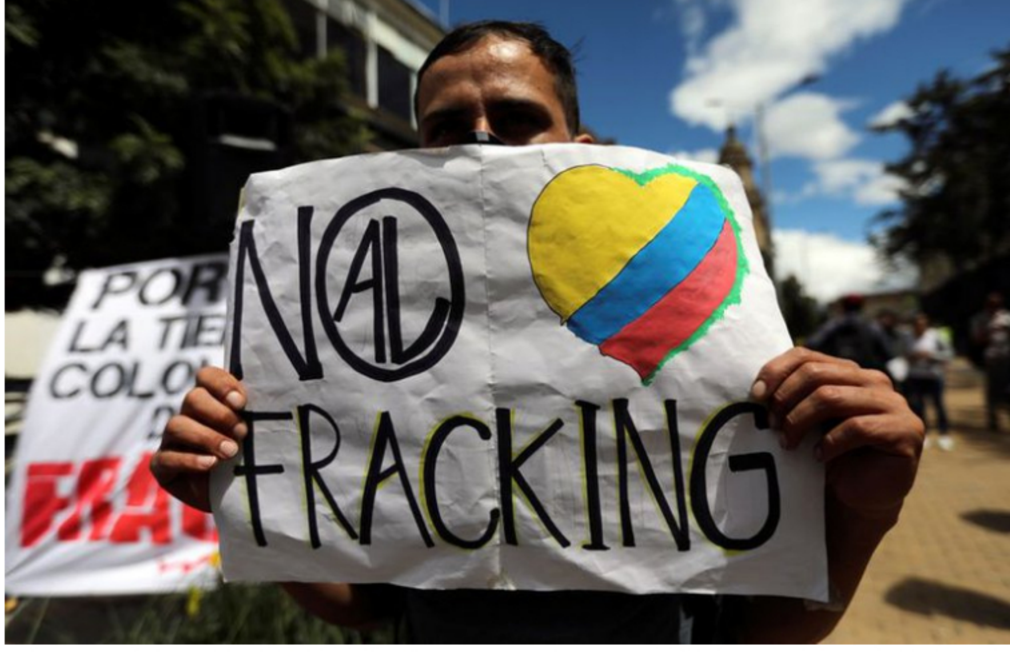
Foto de archivo. Un hombre sostiene un cartel durante una protesta contra el fracking en Bogotá, Colombia, 7 de junio, 2019. REUTERS/Luisa González

Firmado el pasado 24 de diciembre de 2020, el primer proyecto de investigación en Yacimientos No Convencionales bajo la técnica de fracturamiento hidráulico en Colombia, denominado Kalé, generó molestia en la sociedad civil de Puerto Wilches, Santander.