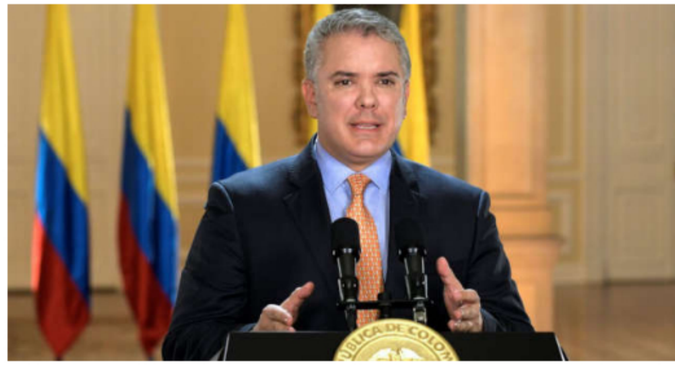
El gobierno del presidente Iván Duque definió las desinversiones como una fuente potencial de ingresos para reducir el déficit fiscal al 7,6% del PIB este año.

ISA, Empresas Públicas de Medellín y Grupo Energía Bogotá declinaron hacer comentarios. El Ministerio de Hacienda y Ecopetrol no respondieron a las solicitudes de comentarios.