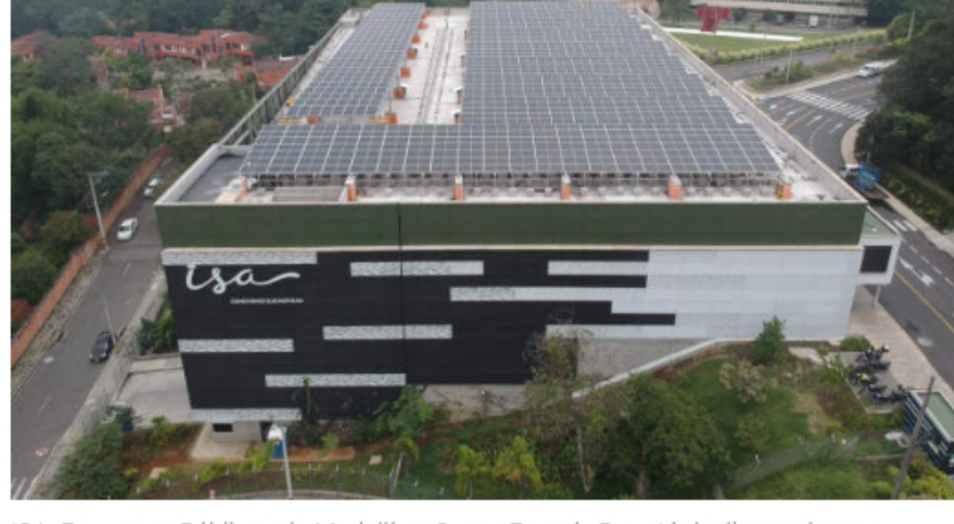
ISA, Empresas Públicas de Medellín y Grupo Energía Bogotá declinaron hacer comentarios. El Ministerio de Hacienda y Ecopetrol no respondieron a las solicitudes de comentarios.

El gobierno colombiano está revisando planes para vender una participación en Interconexión Eléctrica SA que atrae el interés de empresas públicas, según personas con conocimiento directo del tema.