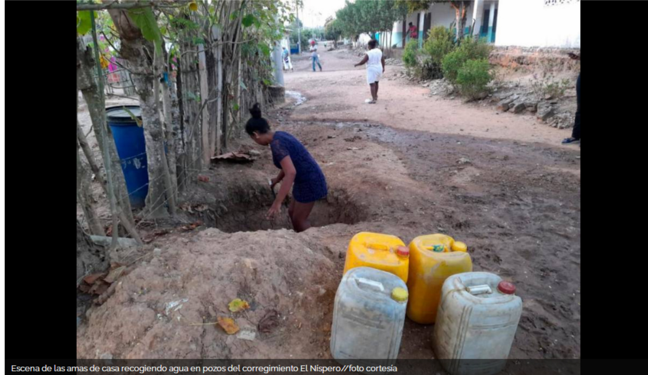
Escena de las amas de casa recogiendo agua en pozos del corregimiento El Níspero

Un concejal asegura que El Níspero está abandonado y la Alcaldía sostiene que está recibiendo atención.