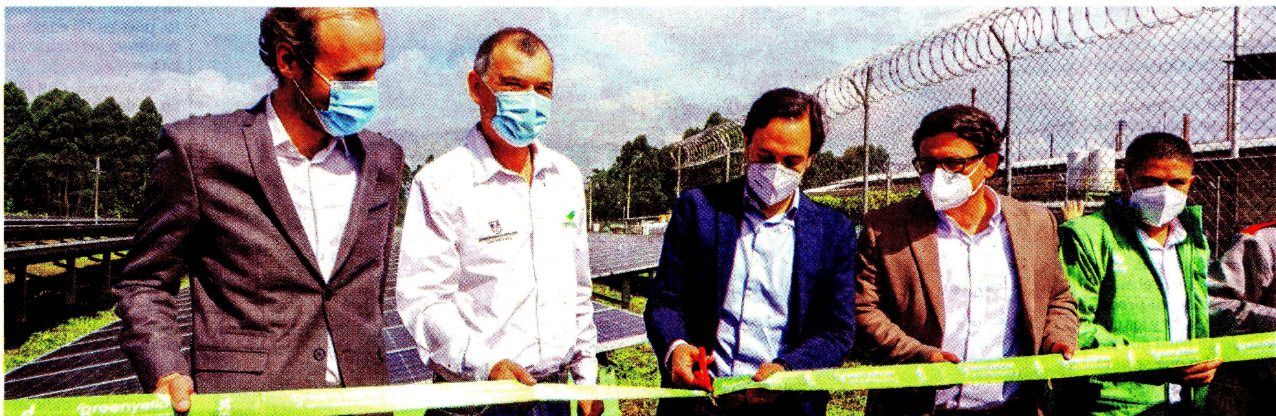
Lanzamiento de la planta solar de Groupe SEB.

Para el 2022 le siguen apostando a la diversificación de la matriz energética de Colombia.