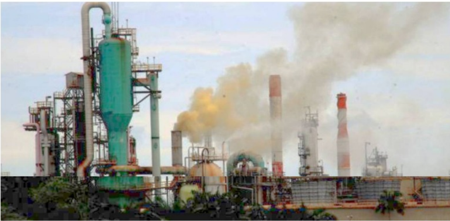
Descartan heridos en explosión en planta Orthoflow

Ecopetrol informó que se presentó un incidente en el área de filtros de la refinería.