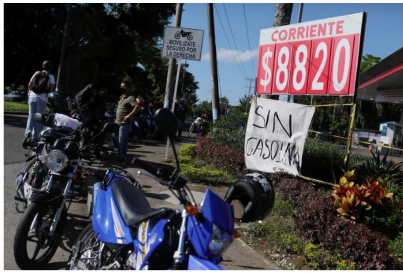
Fendipetróleo alerta por posible desabastecimiento de combustibles en Bogotá

La Federación Nacional de Distribuidores de Combustibles y Energéticos reportó que en las últimas horas en la Planta de Puente Aranda en Bogotá, se han presentado largas filas de vehículos que no han podido abastecerse de combustible, en el lugar no hay gasolina de manera constante y no ha alcanzado para cumplir con la demanda de vehículos en la zona. La Federación aseguró que está trabajando en el seguimiento a las Estaciones de Servicio a nivel nacional en donde han reportado desabastecimiento e hizo un llamado a Ecopetrol para que se garantice el servicio.