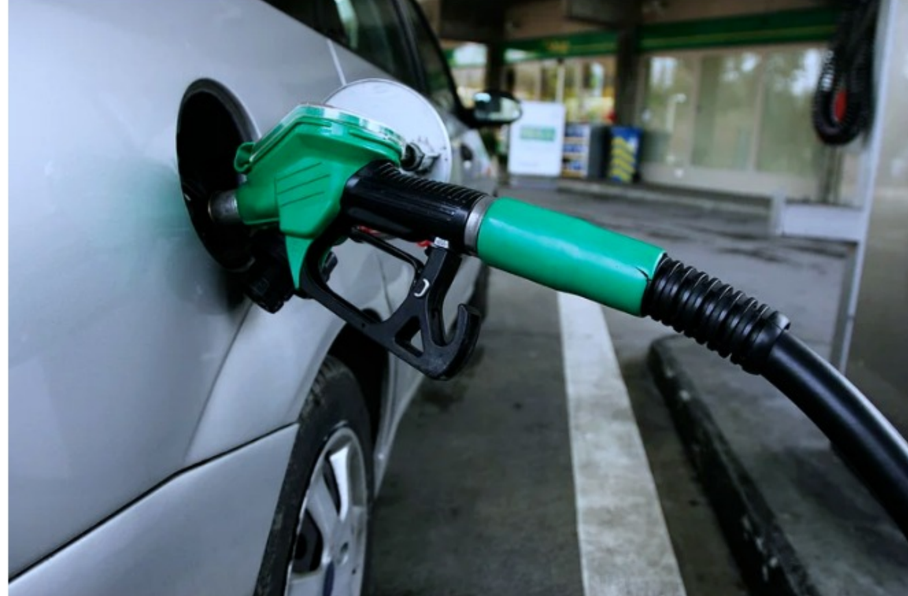
Fendipetróleo alerta por posible desabastecimiento de combustibles en Bogotá

“Es relevante para el sector que la Dirección de Hidrocarburos del Ministerio de Minas y energía informe oportunamente a la opinión pública la verdadera situación de crisis que se está viviendo en estos momentos en la región centro del país, producto del desabastecimiento en las plantas mayoristas”, aseguraron.