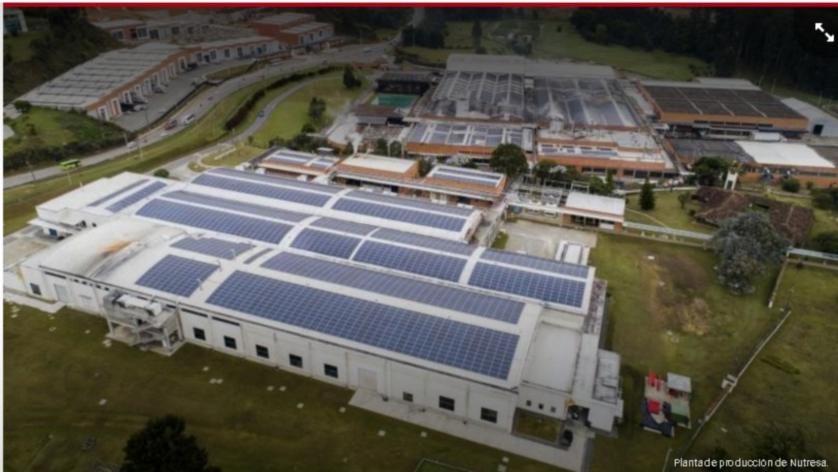
Planta de producción de Nutresa.