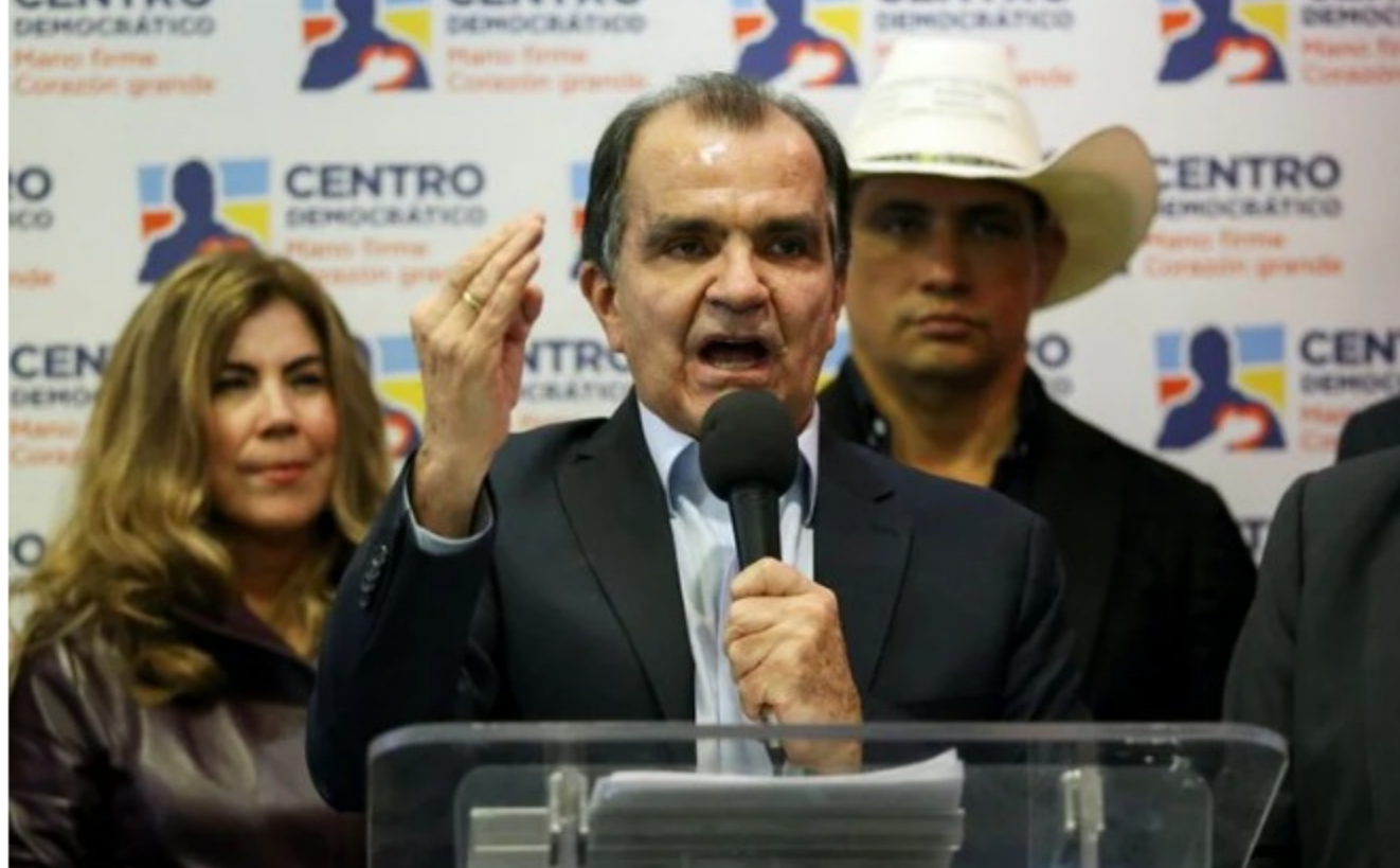
El candidato presidencial del partido Centro Democrático de Colombia, Óscar Iván Zuluaga, habla tras ganar la consulta interna del partido, en Bogotá, Colombia, 22 de noviembre, 2021.