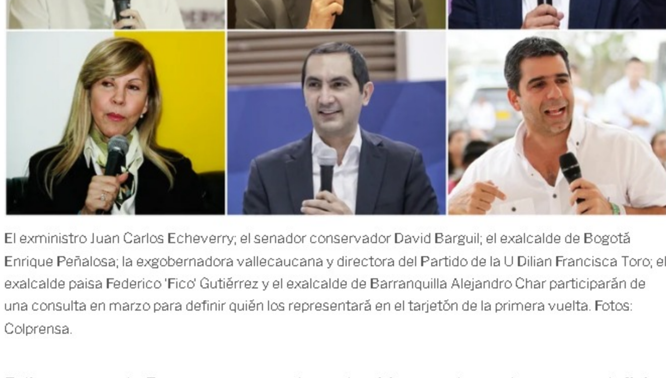
El exministro Juan Carlos Echeverry, el senador conservador David Barguil, el exalcalde de Bogotá Enrique Peñalosa, la exgobernadora vallecaucana y directora del Partido de la U Dilian Francisca Toro, el exalcalde paísa Federico 'Fico' Gutiérrez y el exalcalde de Barranquilla Alejandro Char participarán de una consulta en marzo para definir quién los representará en el tarjetón de la primera vuelta.

Faltan menos de 5 meses para que los colombianos salgan a las urnas a definir a su próximo presidente y, semana tras semana, desde que inició la carrera por disputarse la estadia en la Casa de Nariño se siguen conociendo alianzas políticas que buscan un único objetivo: suceder a Iván Duque en el poder . Quizá de las que más ha resonado en la opinión pública es la ‘Coalición de la Experiencia’, recién bautizada como ‘Equipo por Colombia’ , y que aglutina a personajes ya muy conocidos de la centroderecha nacional.