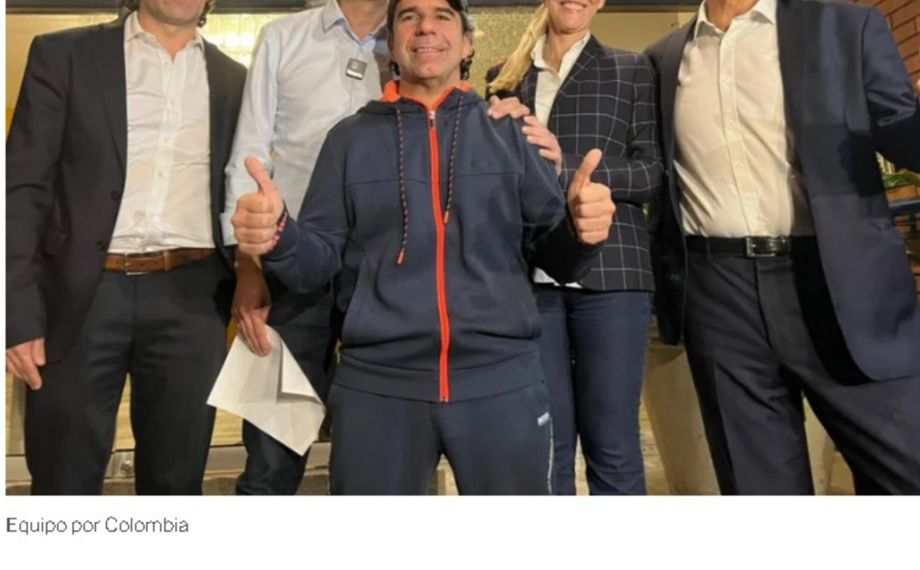
Equipo por Colombia

Tal parece que la lucha contra la pobreza que aqueja a millones de colombianos será uno de los ejes en los que más hará fuerza esa alianza política. O así lo ratificó la exgobernadora del Valle del Cauca, Dilian Francisca Toro, que también le dijo a Infobae que desde el Equipo por Colombia no solo quieren “defender la democracia” de “propuestas temerarias” , sino que también quieren “derrotar la pobreza generando más y mejor empleo” garantizando el enfoque en las regiones.