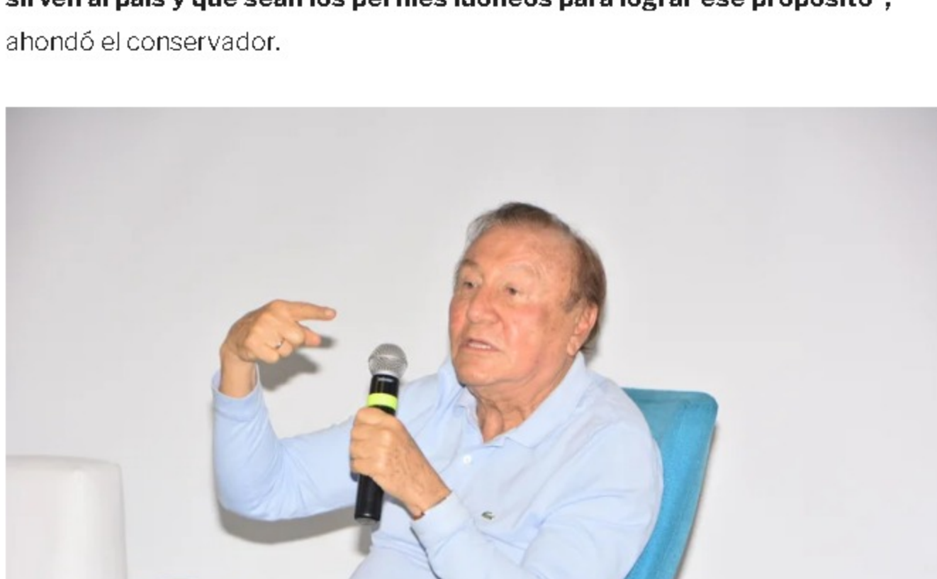
Rodolfo Hernández, exalcalde colombiano.