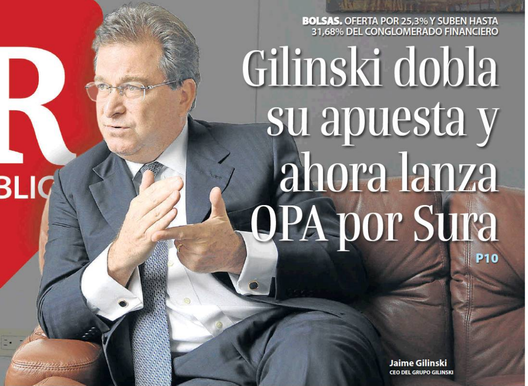
Jaime Gilinski CEO DEL GRUPO GILINSKI