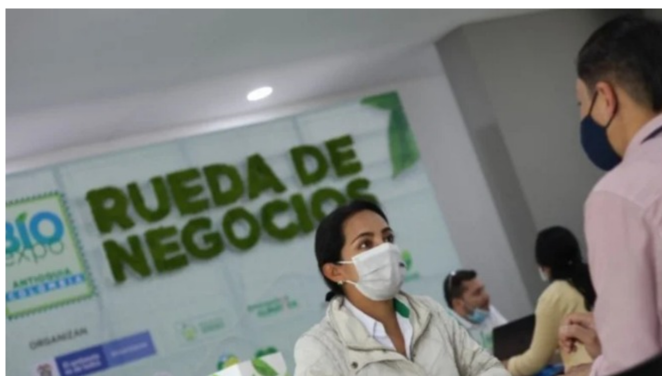
Bioexpo. Más de 6000 millones de pesos en oportunidades de negocios para empresarios verdes. Minambiente.

La feria Bioexpo Antioquia 2021 se llevó a cabo en Medellín entre el 18 y 20 de noviembre, como un encuentro comercial en el que participaron más de 560 empresarios de negocios verdes y sostenibles, 359 compradores nacionales y 206 internacionales. En el marco del evento se realizaron ruedas de negocios que, de acuerdo con el Ministerio de Ambiente y Desarrollo Sostenible, arrojaron más de 6.000 millones de pesos en oportunidades para los empresarios verdes del país.