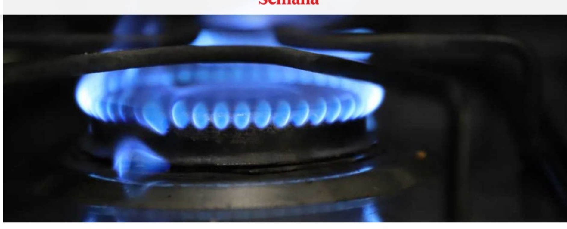
Gas natural domiciliario. - Foto: EPM

Vanti informó en la mañana de este lunes que, debido a una situación de fuerza mayor ocurrida el domingo en horas de la noche, se suspendió el servicio de gas natural para industrias y vehículos en Bogotá, Boyacá, Cundinamarca y Santander.