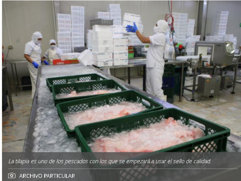
La tilapia es uno de los pescados con los que se empezará a usar el sello de calidad.