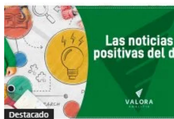
Noticias positivas del gremio Acrip, AmCham y AEI Spaces