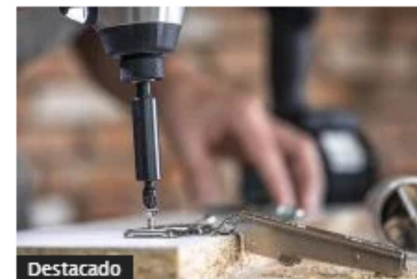
Encuesta Opinión Industrial Andi: producción y ventas subieron con fuerza en primer semestre