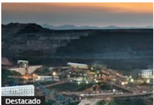
Schneider Electric y Aveva mejoran operaciones de Vale Mining