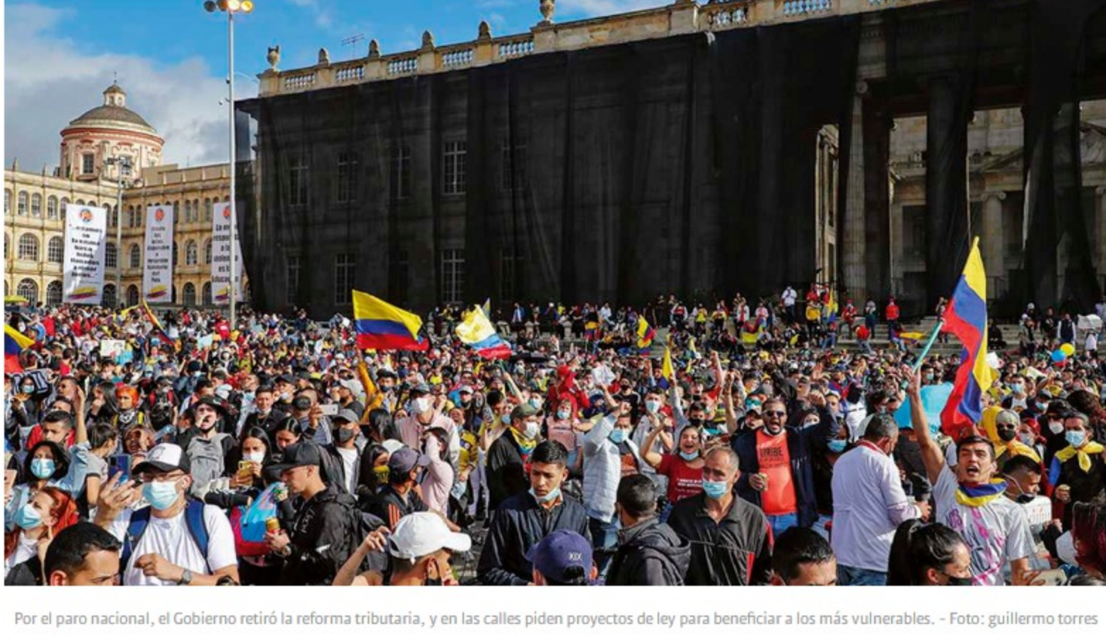
Por el paro nacional, el Gobierno retiró la reforma tributaria, y en las calles piden proyectos de ley para beneficiar a los más vulnerables.

En esta oportunidad el principal argumento del Comité del Paro no es que la nueva reforma tributaria se meta con el IVA o que les suba los impuestos a las clases medias y pobres, sino uno bastante sugestivo: consideran lesivo el nuevo plan de austeridad del Gobierno. Toda una paradoja.