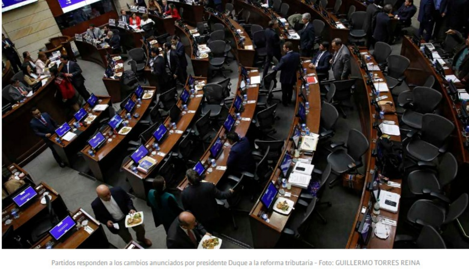
Partidos responden a los cambios anunciados por presidente Duque a la reforma tributaria - Foto: GUILLERMO TORRES REINA

En esta oportunidad el principal argumento del Comité del Paro no es que la nueva reforma tributaria se meta con el IVA o que les suba los impuestos a las clases medias y pobres, sino uno bastante sugestivo: consideran lesivo el nuevo plan de austeridad del Gobierno.