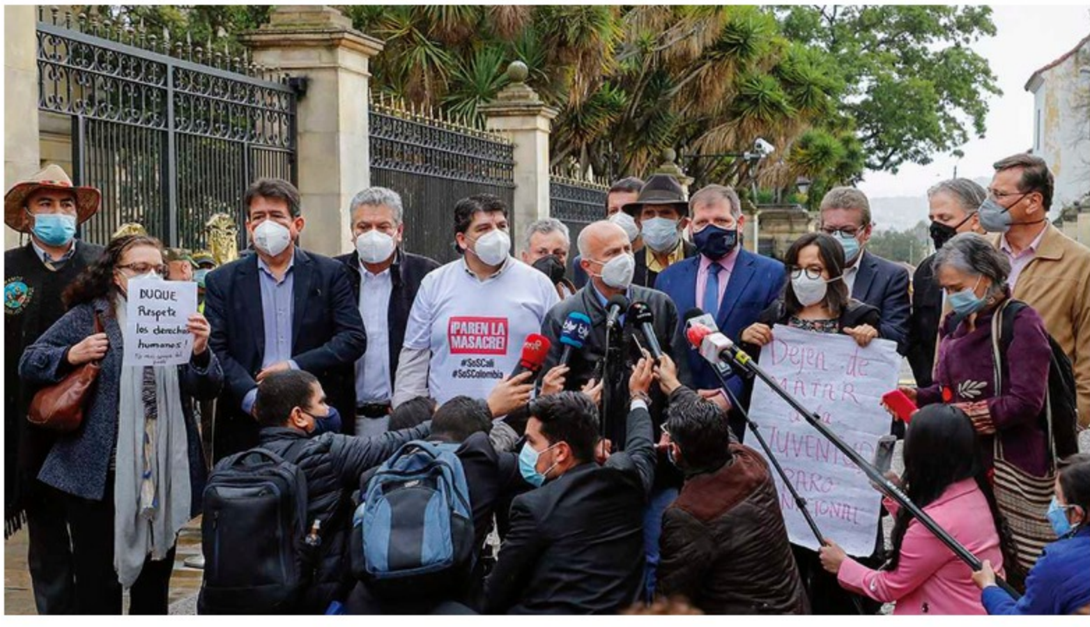
Los voceros del Comité Nacional del Paro han perdido representatividad. Algunos de ellos han admitido que tienen fines políticos para las elecciones de 2022.

Con este congelamiento salarial de los servidores públicos y otras disposiciones para reducir el gasto, el Gobierno le apunta a economizar 1,9 billones de pesos.