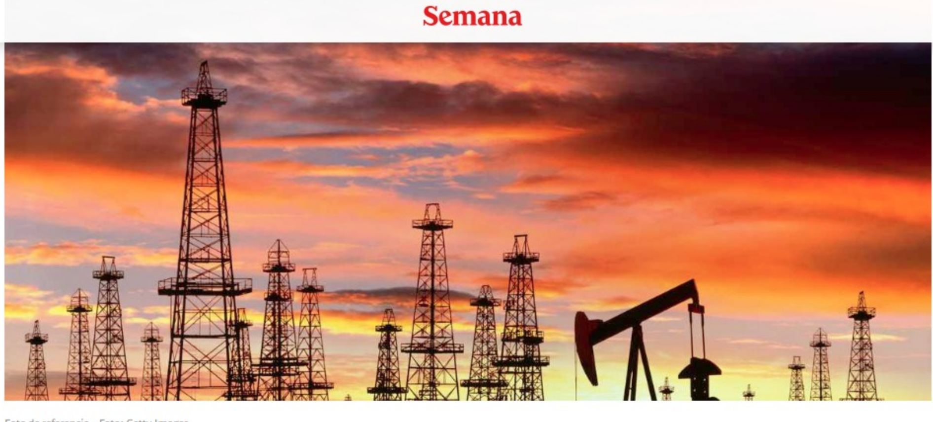
Foto de referencia

El senador y precandidato presidencial Jorge Enrique Robledo consideró que su homólogo Gustavo Petro incurre en un “garrafal error” si acaba con la industria del petróleo. Y peor aún, dijo, sugerir que con 12 millones de turistas nuevos en Colombia se suplen los ingresos derivados del mismo.