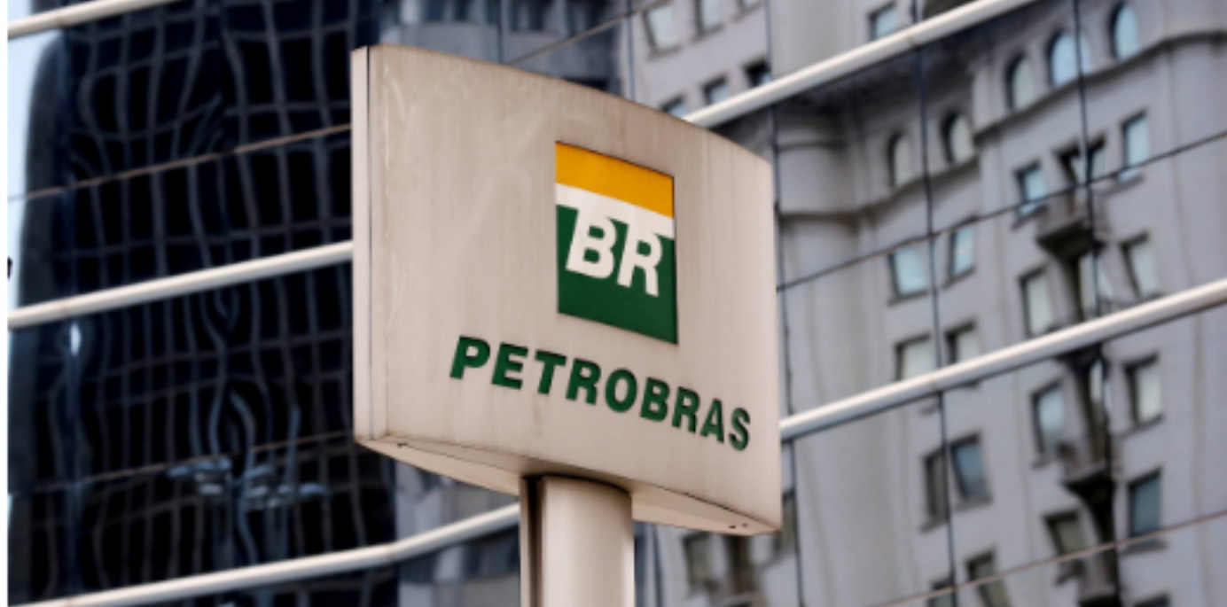
La semana pasada, el Comité Especial de Licitaciones (CEL) aprobó la participación de Petrobras, Chevron, Shell, TotalEnergies, Ecopetrol y Murphy

La agencia reguladora ANP aprobó el registro de la petrolera australiana Karoon para participar en la XVII Ronda de Licitaciones por bloques exploratorios petroleros , prevista para el 7 de octubre, sumando así un total de siete empresas registradas hasta el momento, informó este miércoles la autarquía.