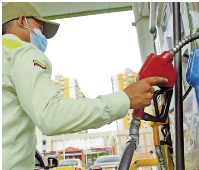
Una estación de gasolina en Barranquilla.

"Las estaciones de servicio de Primax en la región caribe continúan atendiendo a sus clientes. Es cierto que se presentaron disminuciones en los niveles de inventario llevándolas a mínimos, pero tra-