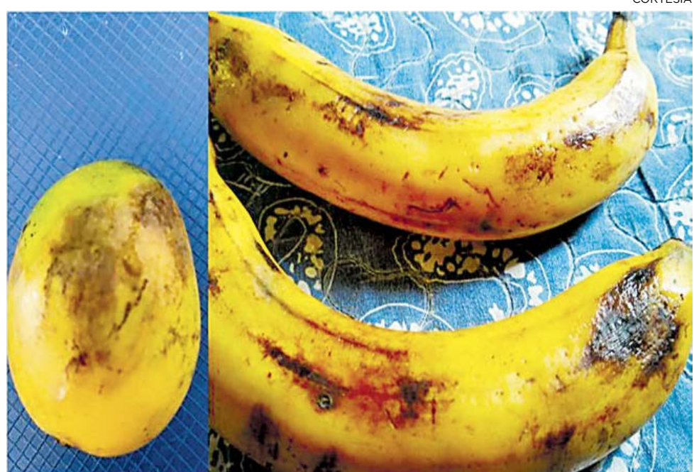
Aspecto de las frutas que fueron encontradas en mal estado.

"Hemos verificado que aquí (Cartagena), efectivamente se están entregando las meriendas balanceadas desde el punto de vista nutricional y vamos a seguir haciendo el seguimiento para que efectivamente lle-