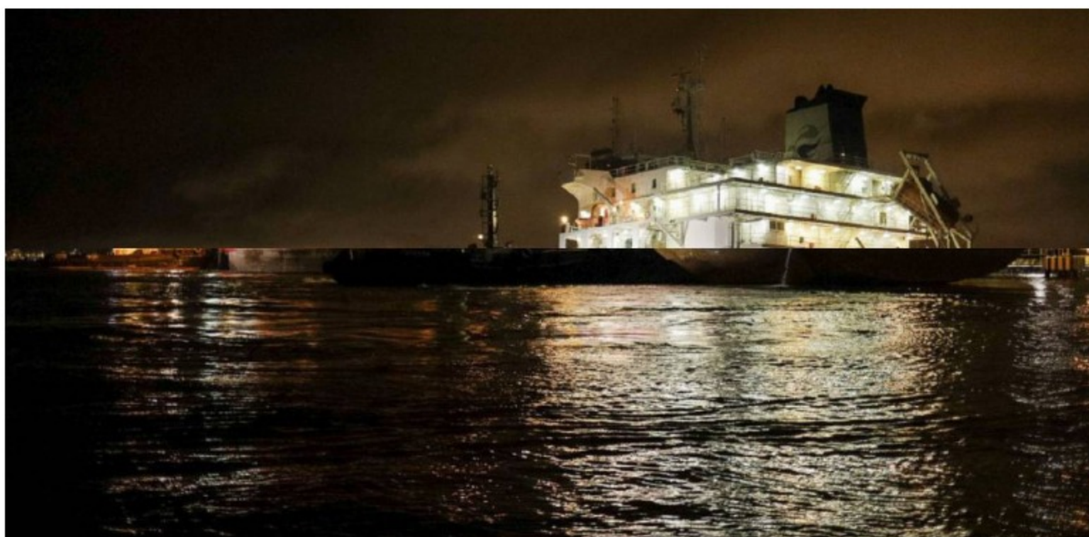
111 mil barriles se recibieron en el terminal marítimo de la refinería de Cartagena y 114 mil barriles se entregarán en Barranquilla

111 mil barriles se recibieron en el terminal marítimo de la refinería de Cartagena y 114 mil barriles se entregarán en Barranquilla