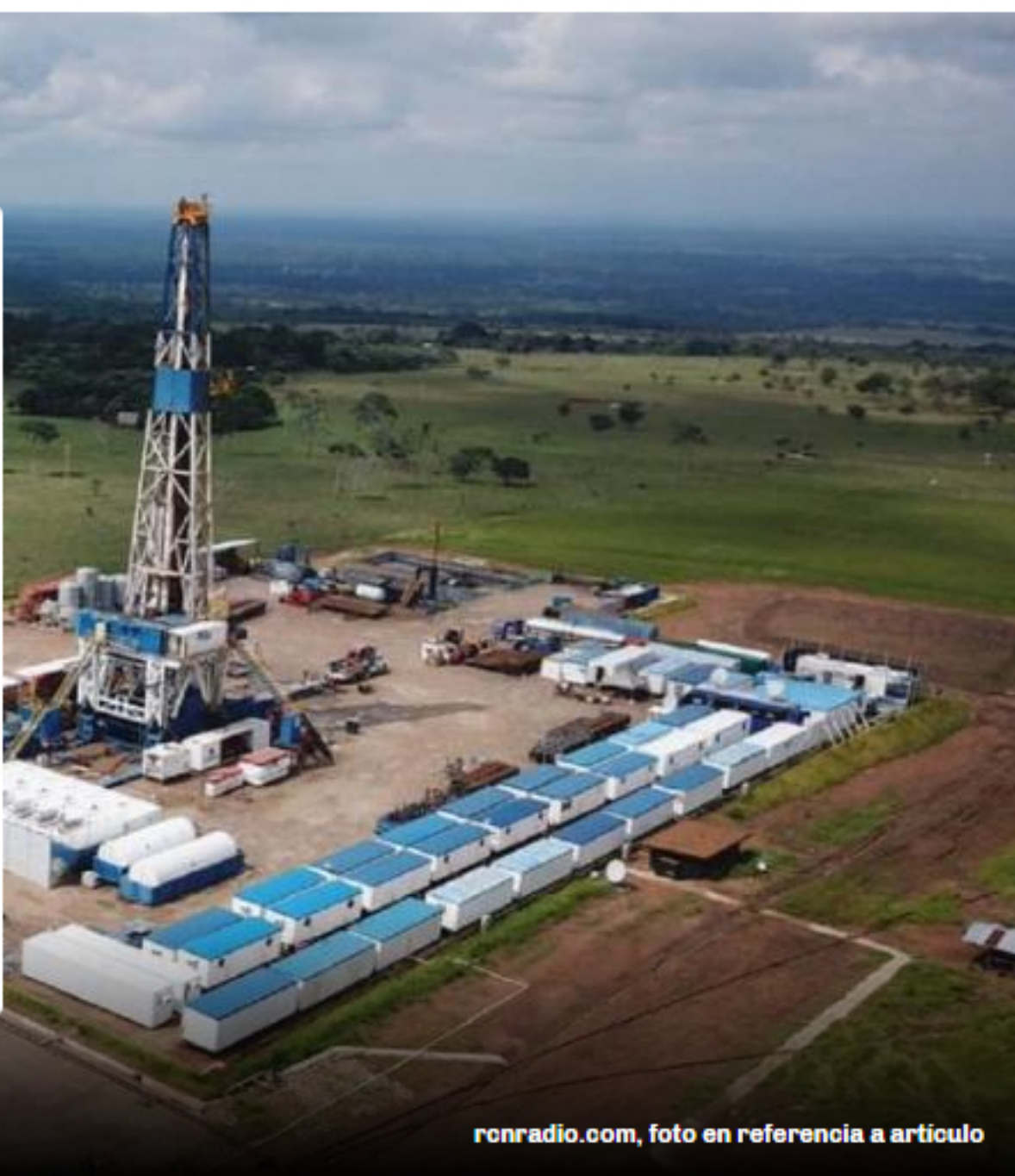
ronradio.com, foto en referencia a artículo